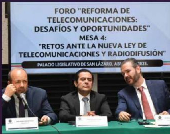
Los senadores propusieron que la reforma sea analizada en conversatorios con especialistas.

Sin embargo, el artículo 12 del proyecto generó diversas inter-