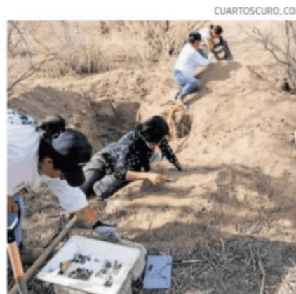
Madres buscadoras, en Zacatecas.

"La implementación de estos protocolos no es sólo una medida de justicia y reconocimiento hacia estas familias que buscan a sus seres queridos, sino también