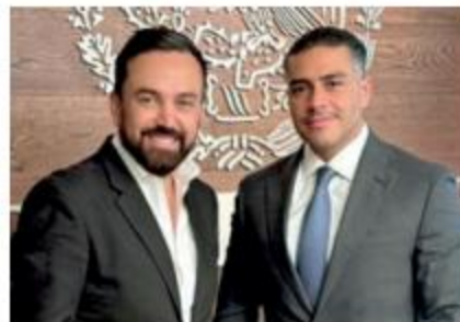
Los funcionarios durante el encuentro

García Harfuch detalló que 27 entidades federativas reportan reducciones en homicidios dolosos, destacando Guanajuato con una baja del 48%, Guerrero con 46.1%, Baja California con 31.3%, entre otros. ●