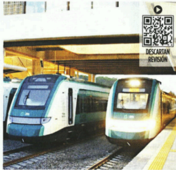
El Tren Maya fue una de las obras construidas durante la gestión de Andrés Manuel López Obrador.

“No están de acuerdo que se haya construido un tren, que haya regresado los