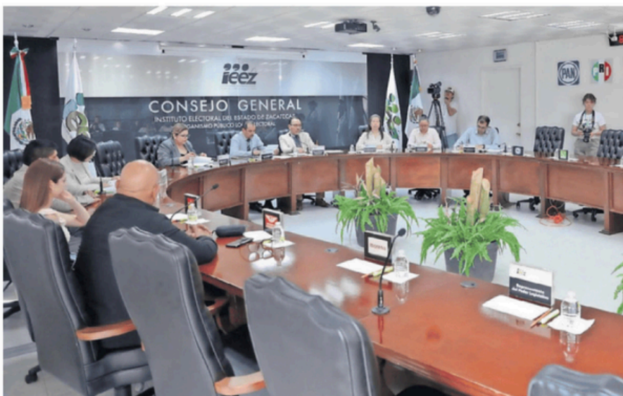
El Instituto Electoral de Zacatecas cuenta con un déficit de 23 millones 37 mil pesos para poder llevar a cabo la elección del Poder Judicial el próximo 1 de junio. Otros estados se encuentran en condiciones similares.