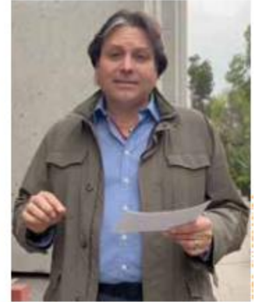
Mario Zamora Gastélum, diputado del Partido Revolucionario Institucional

Destacó que la regulación busca equiparar los derechos de los trabajadores sexuales