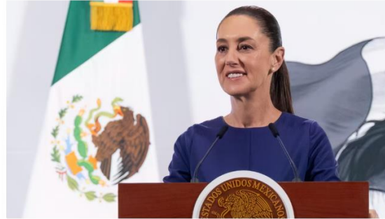
Sheinbaum adelantó que próximamente mostrará el informe que realizó la ASF sobre el Fobaproa en 1998.

La presidenta Claudia Sheinbaum Pardo hizo un llamado a que los senadores de Morena que propusieron crear una comisión para investigar al exmandatario priista, Ernesto Zedillo , revisen previamente el informe que realizó en 1998 la entonces Auditoría Superior de la Federación (ASF), actualmente Secretaría de Anticorrupción y Buen Gobierno, sobre el Fobaproa .