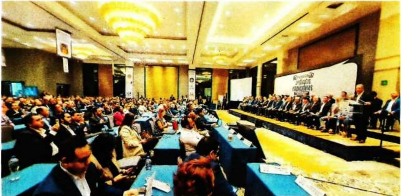
Es una integración histórica entre sindicatos y patrones.

REPRESENTACIONES de trabajadores y 13 más del sector empresarial crearon un órgano consultivo.