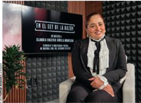
LA CANDIDATA a magistrada de circuito en materia civil, en entrevista con La Razón.

› CANDIDATA magistrada considera que un problema es el retardo en la impartición de justicia; propone que ésta sea cercana, con sentencias entendibles y medios alternos en juicios