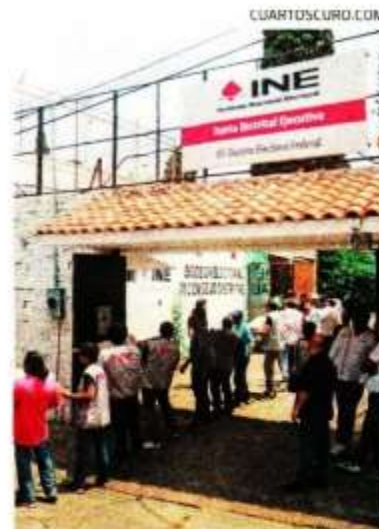
A Morelos llegaron boletas electorales.

La gente irá a votar, apuntó, “porque está harta de la corrupción, de los privilegios, de la antidemocracia, y la votación será muy amplia, de todos los sectores sociales, porque no se nos olvide que hubo, en el periodo moderno, tres fraudes electorales: el de 1988, el de 2006 y el de 2012; entonces, ¿cuál democracia? La votación del 1 de junio será masiva, libre e inédita”.