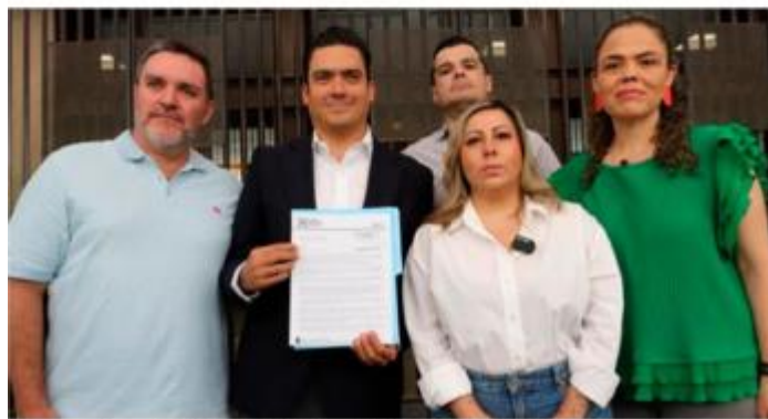
Integrantes del CEN del PAN en Relaciones Exteriores.

Por ello emplazaron a la Cancillería, informe, con base en el Derecho de Petición consagrado en el artículo 8º Constitucional, si a sido notificada oficialmente por el gobierno estadounidense sobre esa situación y ofrezca una explicación detallada sobre la existencia de restricciones migratorias activas impuestas a funcionarios y exfuncionarios mexicanos en el marco de investigaciones por sus presuntos vínculos con el crimen organizado. (Alejandro Páez)