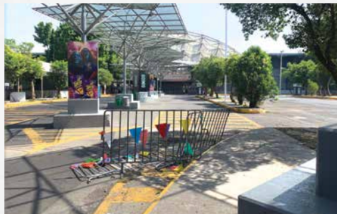
En el Palacio de los Deportes los letreros publicitarios, así como la fachada y el estacionamiento se encuentran en malas condiciones.

Morena analiza modificaciones a la Ley para la Celebración de Espectáculos Públicos que puedan establecer sanciones más severas y fincar responsabilidades claras en cuestiones de seguridad en eventos masivos