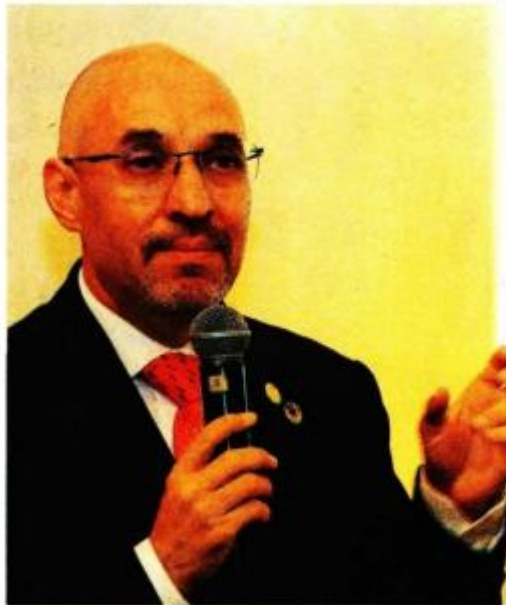
Octavio de la Torre , presidente de Concanaco.