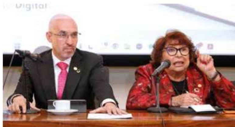
LIDERAZGO. Los presidentes de la Concanaco Servytur, y de la Canacintra.

“Necesitamos una transición que apoye a quien ya opera al límite”,