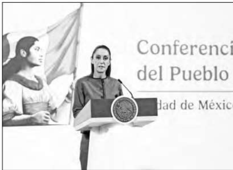
◀ La presidenta Claudia Sheinbaum durante la conferencia de ayer en Palacio Nacional.

En tanto, ante las quejas expresadas por aspirantes y partidos políticos, recordó que corresponde al Tribunal Electoral del Poder Judicial de la Federación analizar los recursos que se presenten. “Se hizo una elección, votó la gente, y si hay una cuestión, hay los canales para poder atender las quejas ante el INE y el Tribunal Electoral”.