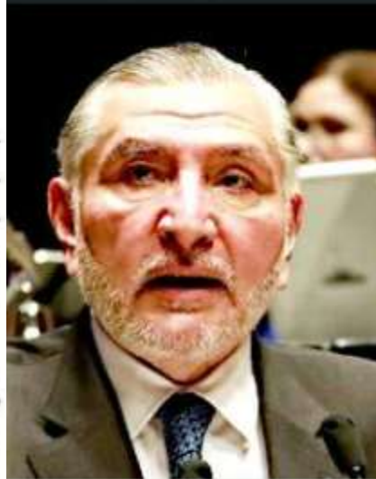
Adán Augusto López, Líder morenista

/// Por favor no participemos ni convoquemos a ninguna marcha ante la Embajada en Paseo de la Reforma”.