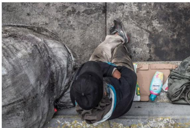
Las evaluaciones de pobreza en el país pasaron a manos del Instituto Nacional de Estadística y Geografía

En México viven 46,8 millones de personas en situación de pobreza y cuenta con múltiples programas de desarrollo social que eran evaluados por el Coneval