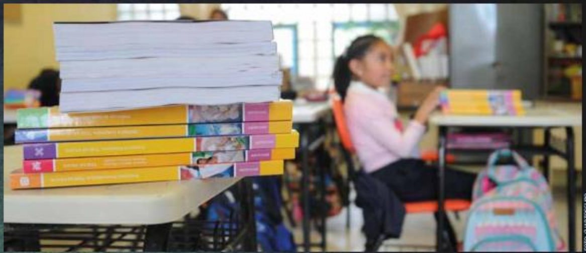
El entorno seguro es esencial para el desarrollo de los alumnos de educación básica.