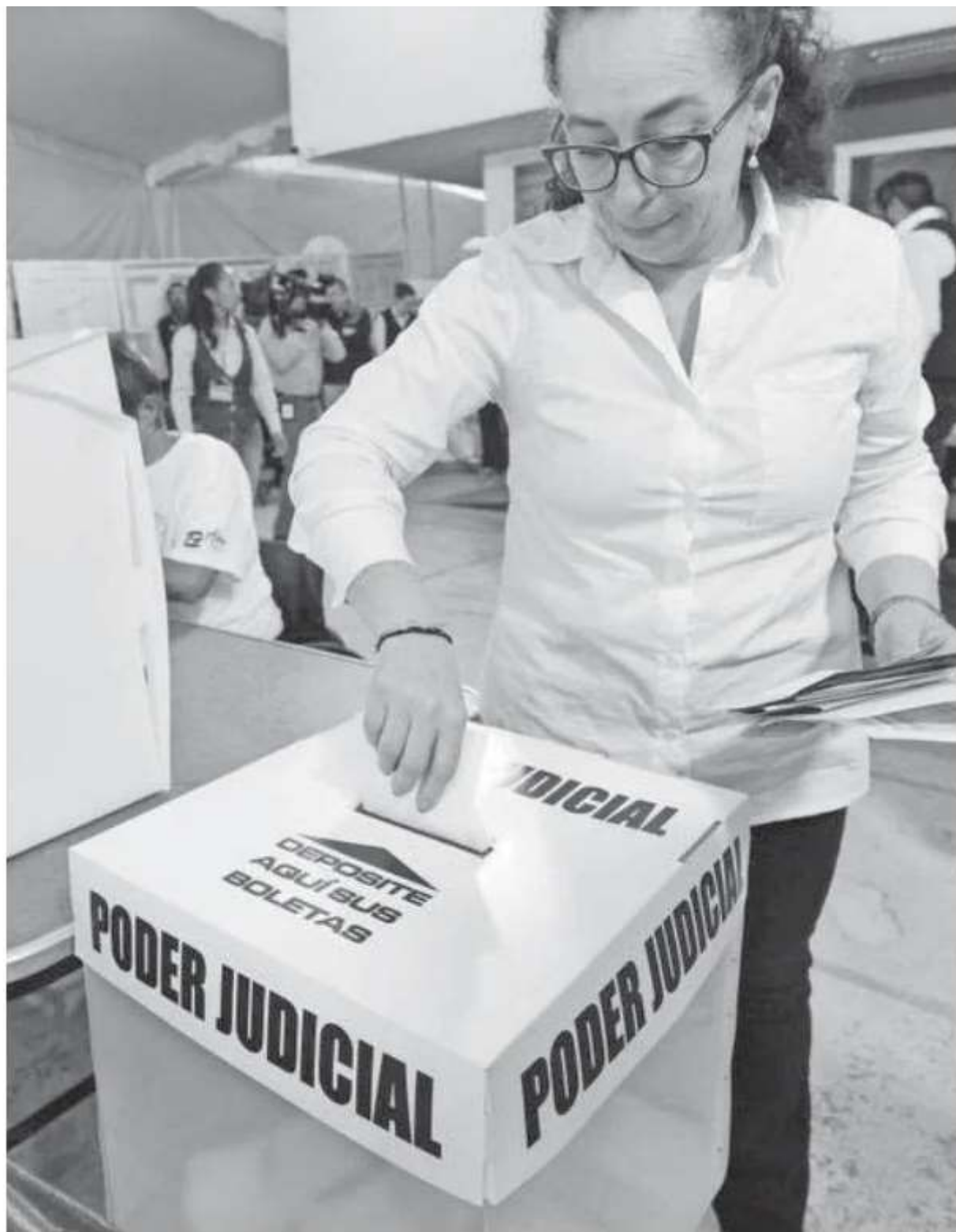
El 1 de junio se eligieron en México a jueces, magistrados y ministros de la Corte