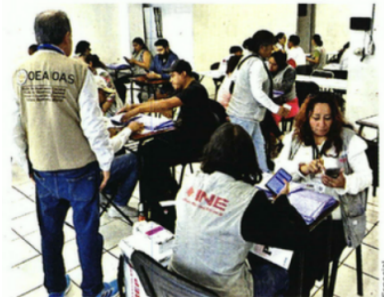
La Misión de Observación Electoral de la OEA, integrada por 16 personas, analizó distintos aspectos de los comicios.

Otros 880 no aprobaron por ser funcionarios, militantes o ligados a candidatos.