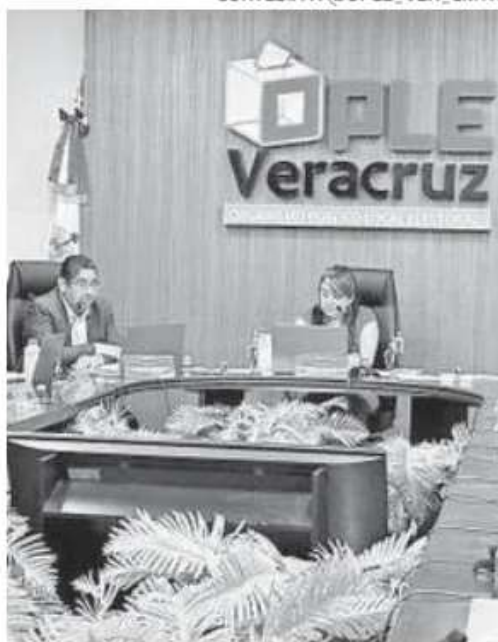
La consejera del OPLE en la sesión

bleció no utilizar el sistema y realizar el escrutinio y cómputo asentando los resultados de forma manual con apoyo de las herramientas informáticas que permitan sistematizar la contabilización de los votos, trabajos deberán iniciar a más tardar el próximo 13 de junio.