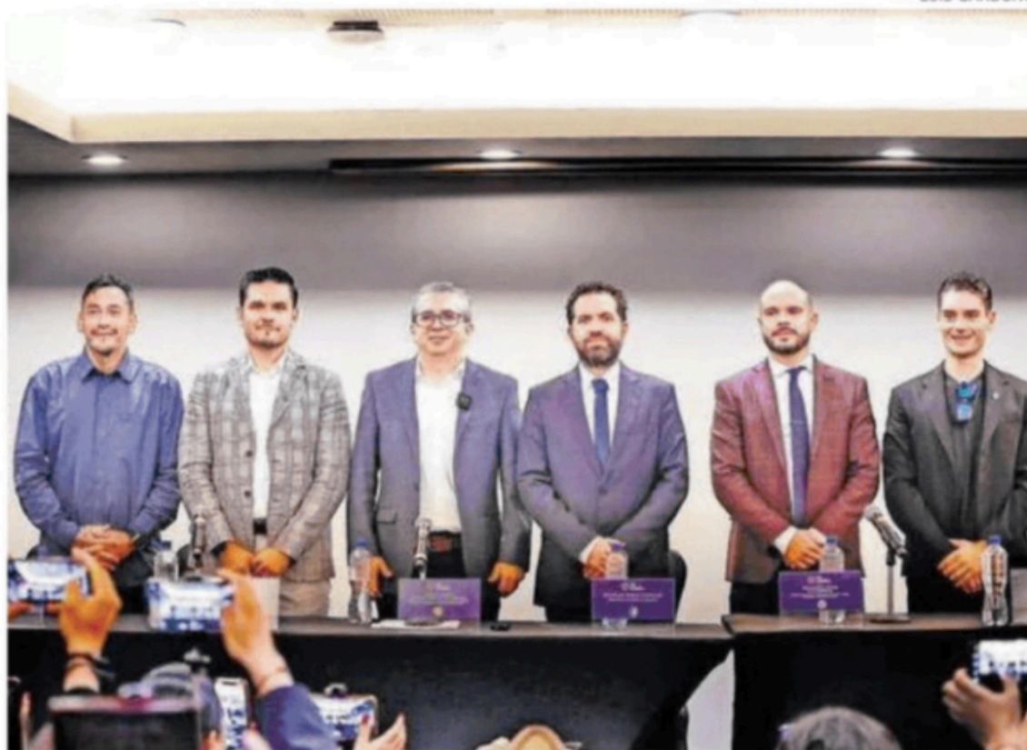
La disputa de clubes de Liga de Expansión contra FMF escala ahora al Senado de la República.