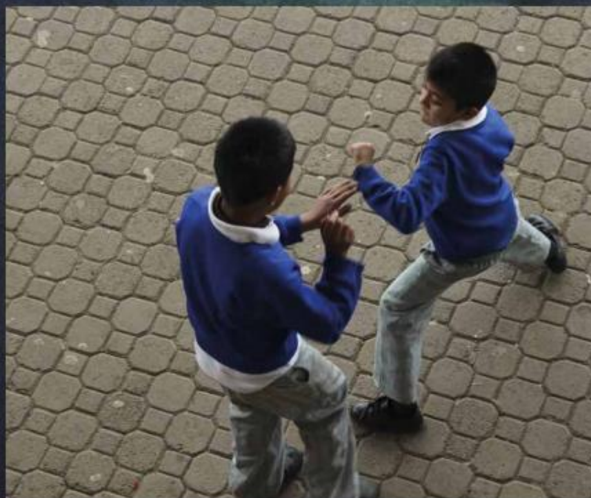
Aunque existen protocolos de combate al acoso escolar, el desinterés por aplicarlos es evidente.

De acuerdo con cifras de Bullying Sin Fronteras, integradas en colaboración con la OCDE, México ocupa el primer lugar mundial en número absoluto de casos de bullying, con más de 28