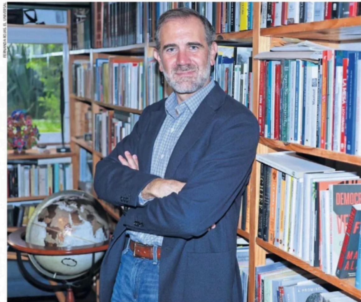
FERNANDA ROSAS, EL UNIVERSAL