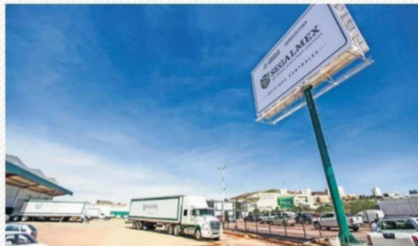
Seguridad Alimentaria Mexicana fue creada por Andrés Manuel López Obrador.

FUNCIÓN PÚBLICA 14. Manejo de los recursos de Segalmex 15. Segalmex 16. Segalmex 17. Segalmex 18. Segalmex 19. Segalmex 20. Segalmex 21. Segalmex 22. Segalmex 23. Segalmex 24. Segalmex 25. Segalmex 26. Segalmex