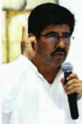
■ Hugo Aguilar, próximo presidente de la SCJN.

La iniciativa de senadores del Partido Verde y de Morena propone los siguientes cambios: