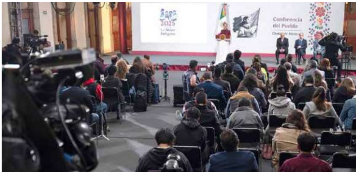
Proceso. Sheinbaum descarta que haya resistencia de los partidos aliados de Morena, tanto el PT como PVEM.

No obstante, insistió en la necesidad de revisar el tema de la elección de legisladores mediante listas plurinominales y planteó, en su lugar, el esquema de primera minoría como se utiliza en el Senado, el cual consiste en asignar un escaño en