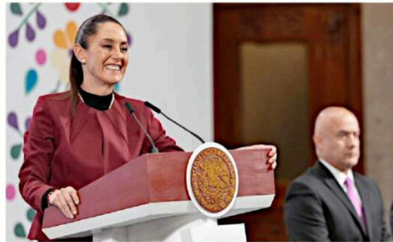
Sheinbaum durante su conferencia en Palacio Nacional.

“Esta idea que hemos vivido de que se ampara al-