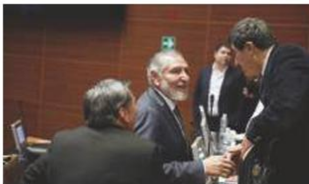
ADÁN AUGUSTO López (c.) conversa con Javier Corral, ayer.

El dictamen fue enviado a la Cámara de Diputados para su discusión y eventual aprobación.