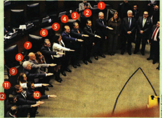
■ Los 12 diplomáticos tomaron protesta de sus cargos en el Senado.