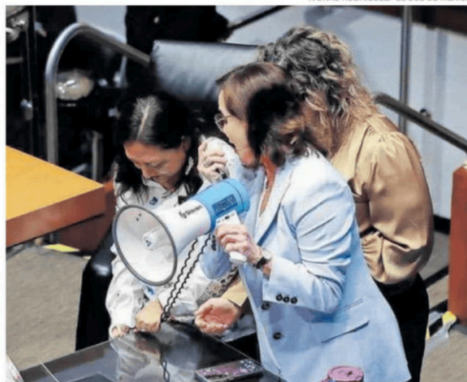
La senadora Lilly Téllez reclamó ayer en la sesión el nombramiento del exfuncionario obradorista.

"Senadora Téllez García, por enésima ocasión, usted falta el respeto a esta sobe-