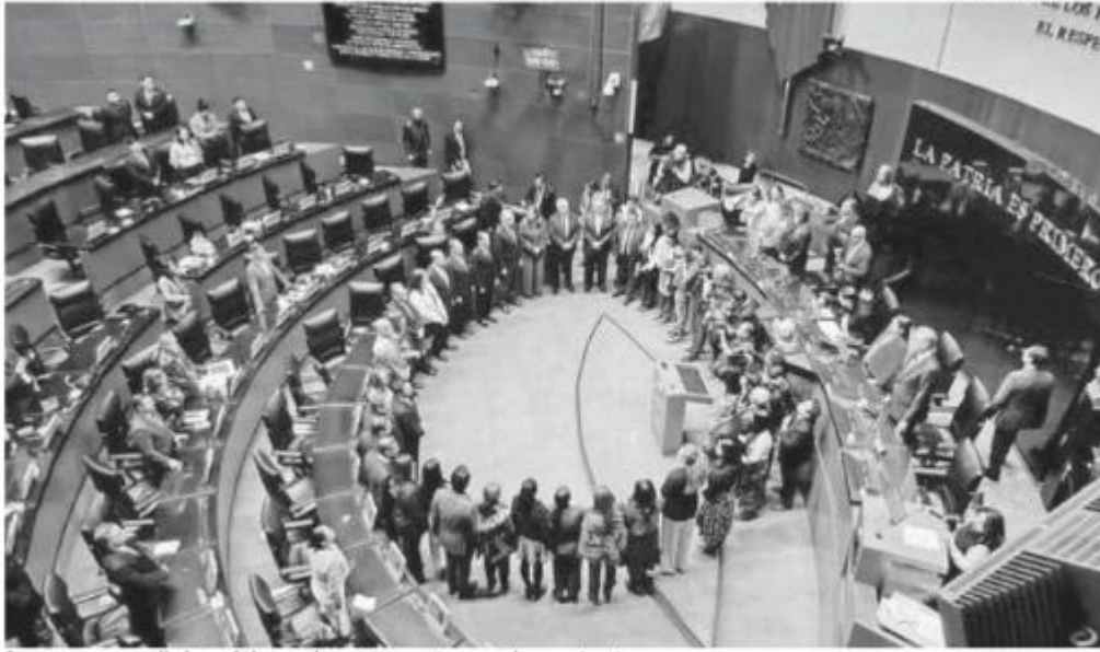
Los nuevos diplomáticos durante su toma de protesta