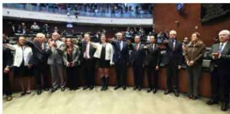
Oposición. La ceremonia se llevó a cabo entre gritos de panistas.