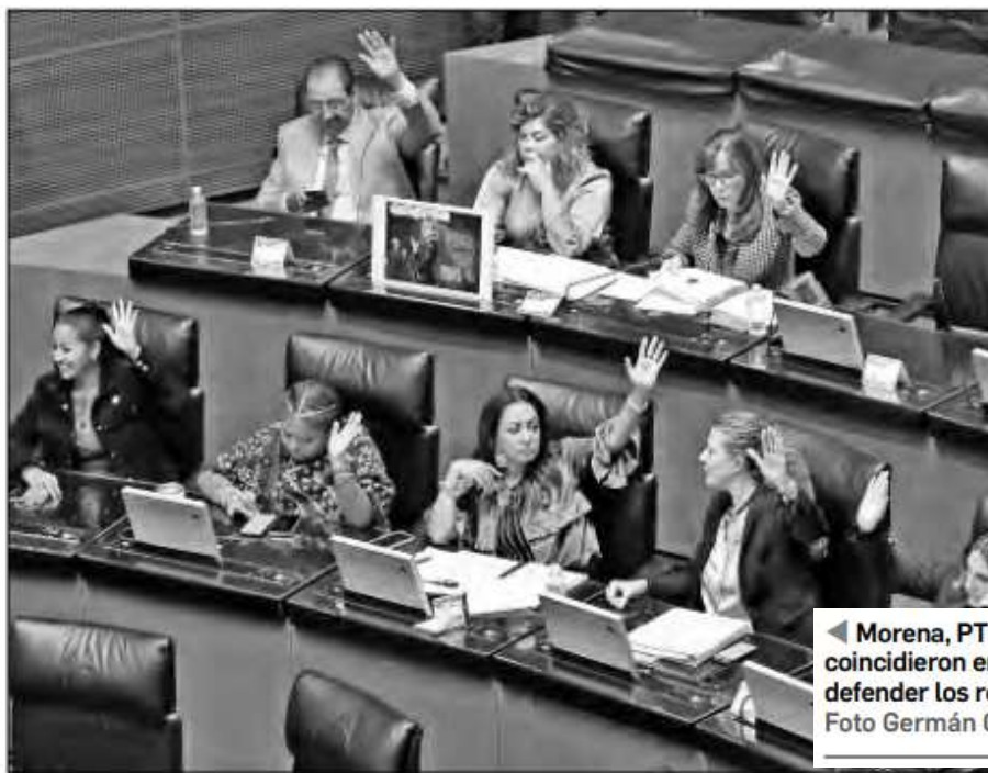
◀ Morena, PT y Partido Verde coincidieron en la importancia de defender los recursos marinos.

Murat explicó que los océanos cubren más de 360 millones de kiló-