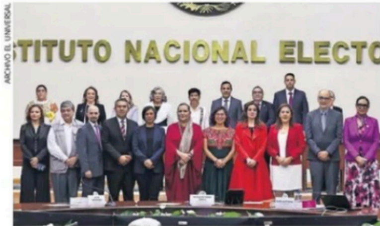
Los ministros electos sostuvieron el lunes una reunión de trabajo para definir el esquema de la SCJN a partir del 1 de septiembre.

“Celebramos nuestra primera reunión de trabajo (...) en un ambiente de unidad y concordia. El espacio fue propicio para conocernos, intercambiar opiniones y planear las actividades que son indispensables atender durante la etapa de transición, así como la definición del plan de trabajo