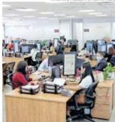
Burócratas en sus oficinas trabajando

establecidos por la Constitución y las leyes aplicables; siendo el caso que la edad mínima de pensión por jubilación para trabajadores al servicio del Estado de 58 años y para trabajadoras al servicio del Estado de 56 años es posible detenerla para el presente año y reducirla gradualmente en los años subsecuentes por motivos de solidaridad y justicia social, para otorgar beneficios superiores a los establecidos en las leyes", señala.