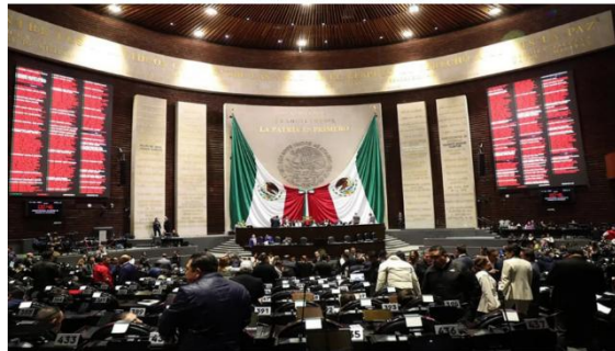
Con 445 votos a favor la nueva ley se envió al Senado para su revisión y posible aprobación, con el objetivo de sustituir la legislación vigente desde el 2009.

La iniciativa busca mejorar la prevención, investigación y persecución de delitos, así como fortalecer la reinserción social y la protección de derechos humanos, con una perspectiva de género.