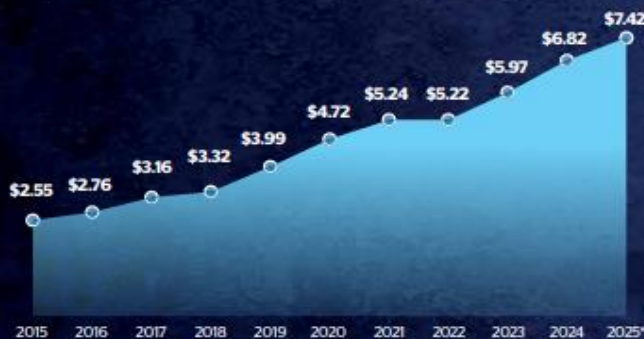
Dato de 2025 hasta mayo FUENTE: CONSAR, 2025

Gracias a los rendimientos generados y a mayores aportaciones patronales a las Afores, los recursos administrados por dicho instrumento financiero superan los siete billones de pesos. Los retiros por desempleo equivalen al 0.4 por ciento del dinero ahorrado por los trabajadores