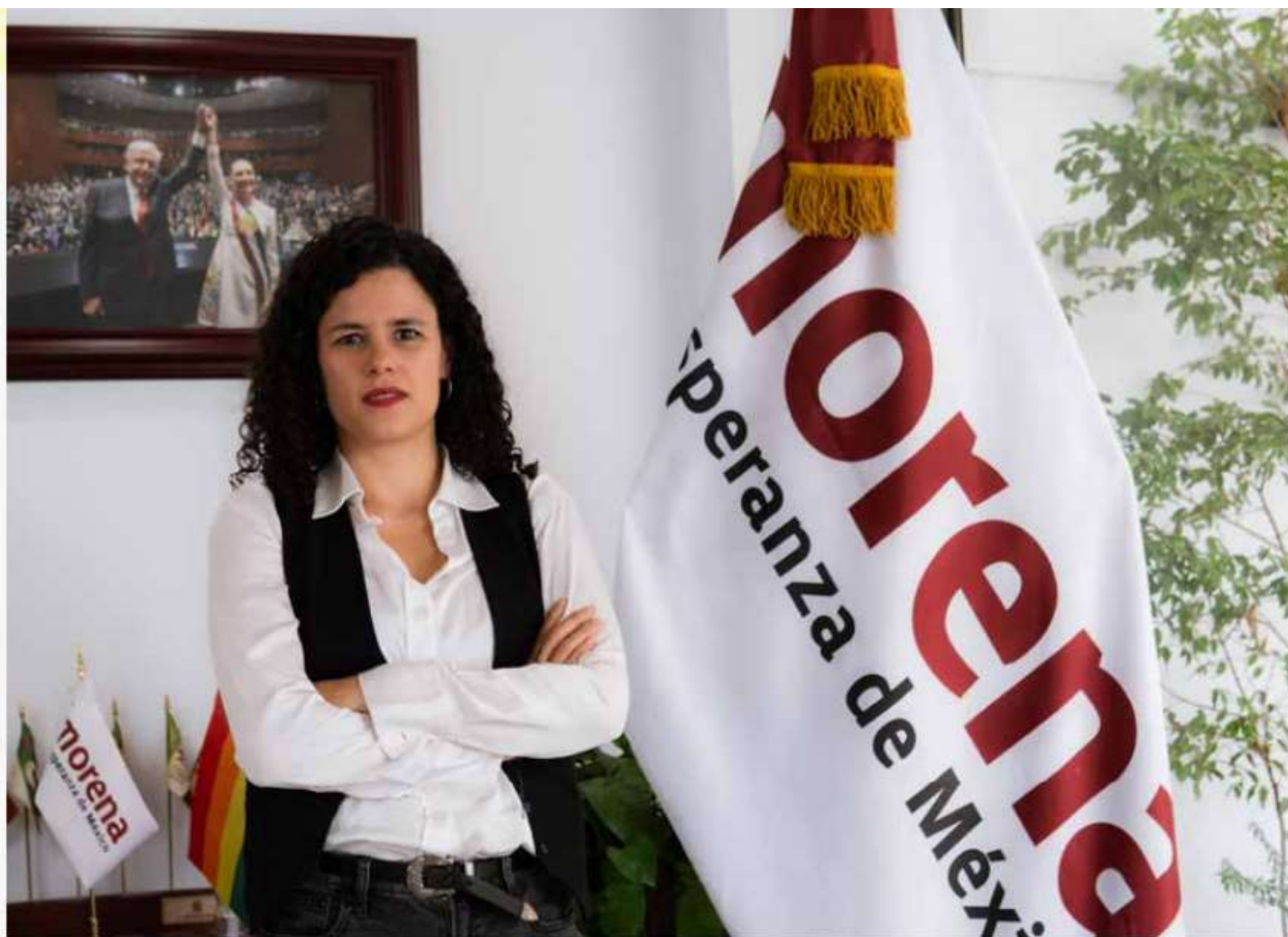
Luisa María Alcalde ha acompañado al movimiento desde su origen como Asociación Civil.

2018. La tercera fue Yeidckol Polevnsky, luego Alfonso Ramírez Cuéllar, Mario Delgado Carillo y actualmente Luisa María Alcalde