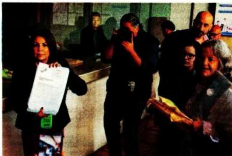
Se prevé que más impugnaciones lleguen contra los comicios al PJ.