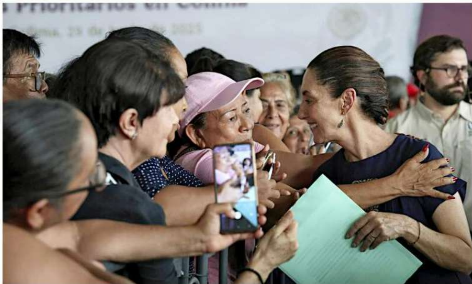
■ La Presidenta Claudia Sheinbaum asistió a la Secundaria Estatal de Talentos No. 12 para la entrega de tarjetas de su programa “La Escuela es Nuestra”.