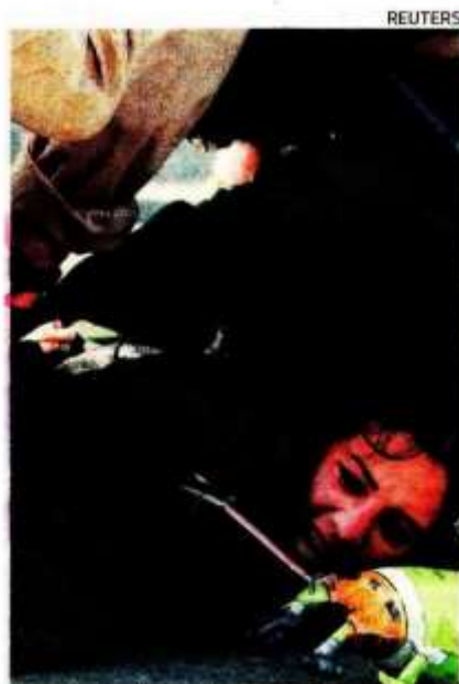
Una mujer, detenida en EA.