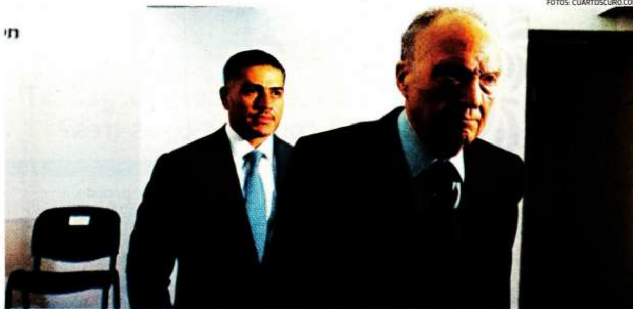
Alejandro Gertz Manero, titular de la FGR, y detrás el secretario de Seguridad y Protección Ciudadana, Omar García Harfuch, ayer.