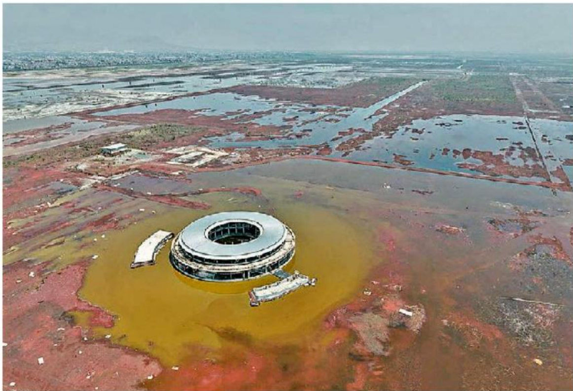
Vista aérea del terreno en donde se estaba construyendo el aeropuerto.

Desde su campaña, el ex presidente acusó que estaba plagado de corrupción