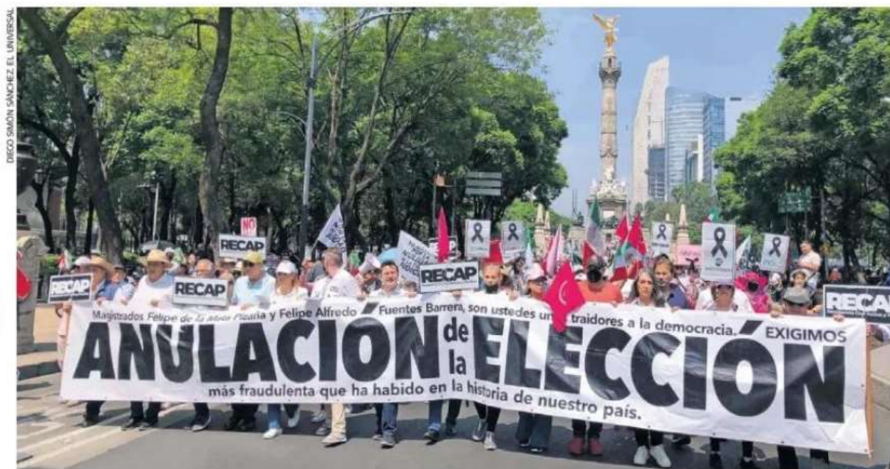
Integrantes de la organización Resistencia Civil, Activa y Pacífica marchan en el Ángel de la Independencia con rumbo al Monumento a la Revolución para exigir al gobierno federal la nulidad de las elecciones del Poder Judicial del domingo 1 de junio.

Dijo que lo que el Ejecutivo buscó con la reforma judicial, y está por lograr, es un Poder Judicial de rodillas, sometido a los intereses de los amigos del régimen. ●