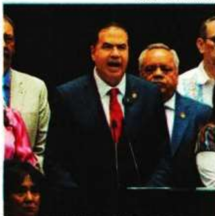
El diputado petista Ricardo Mejía Berdeja realizó el planteamiento.