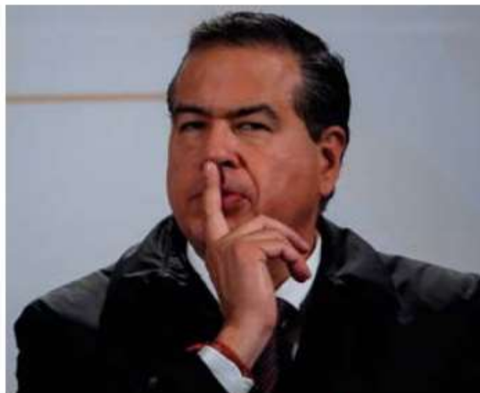
Señalado. Ricardo Mejía Berdeja fue subsecretario de Seguridad federal.

También pidió que el INE y la Fiscalía Especializada en Delitos Electorales mantengan vigilancia estricta para evitar que recursos de origen ilícito sean utilizados por Ricardo Mejía o su partido en futuros procesos electorales.