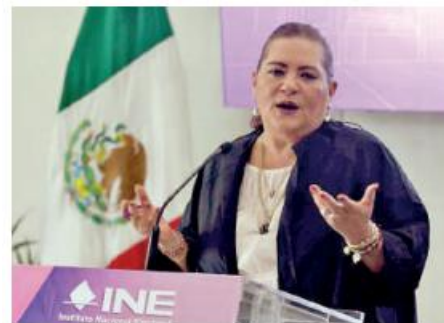
Guadalupe Taddei , presidenta del INE.

Taddei también informó que durante su reciente conversación con la secretaria de Gobernación, Rosa Icela Rodríguez, no se abordó el tema de la CURP biométrica, sino asuntos relacionados con el proceso electoral 2024. ●