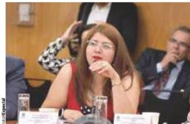
LA DIPUTADA MORENISTA Miroslava Shember en foto de archivo del pasado 27 de marzo.