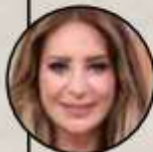
› Geraldine Bazán (actriz)