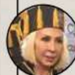
› Laura Bozzo (conductora de televisión)