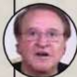
› Carlos Villagrán “Kiko” (actor)