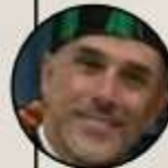
› Sergio Mayer (actor y político)