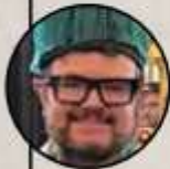
› Aleks Syntek (cantante y compositor)

Estos son algunos personajes polémicos que han recibido doctorados honoríficos de dudosa legitimidad