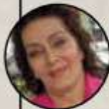
› Irma Dorantes (actriz)