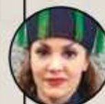
› Tatiana (cantante)