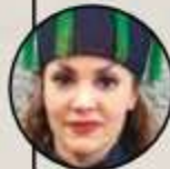
› Tatiana (cantante)