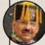
› Carlos Pozos *Conocido como Lord Molécula (youtuber)