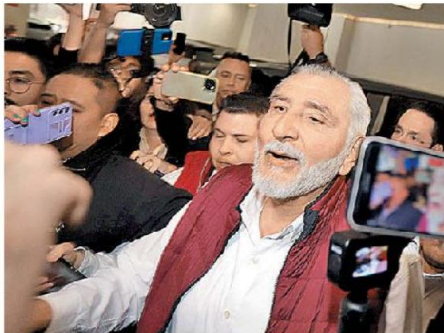
El senador previo al evento. JAVIER RÍOS

Adán salió del Consejo de Morena dando la cara a la militancia, que le recordó que “no está solo!”, pero la dirigencia minimizó su presencia. —