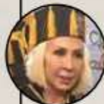
› Laura Bozzo (conductora de televisión)