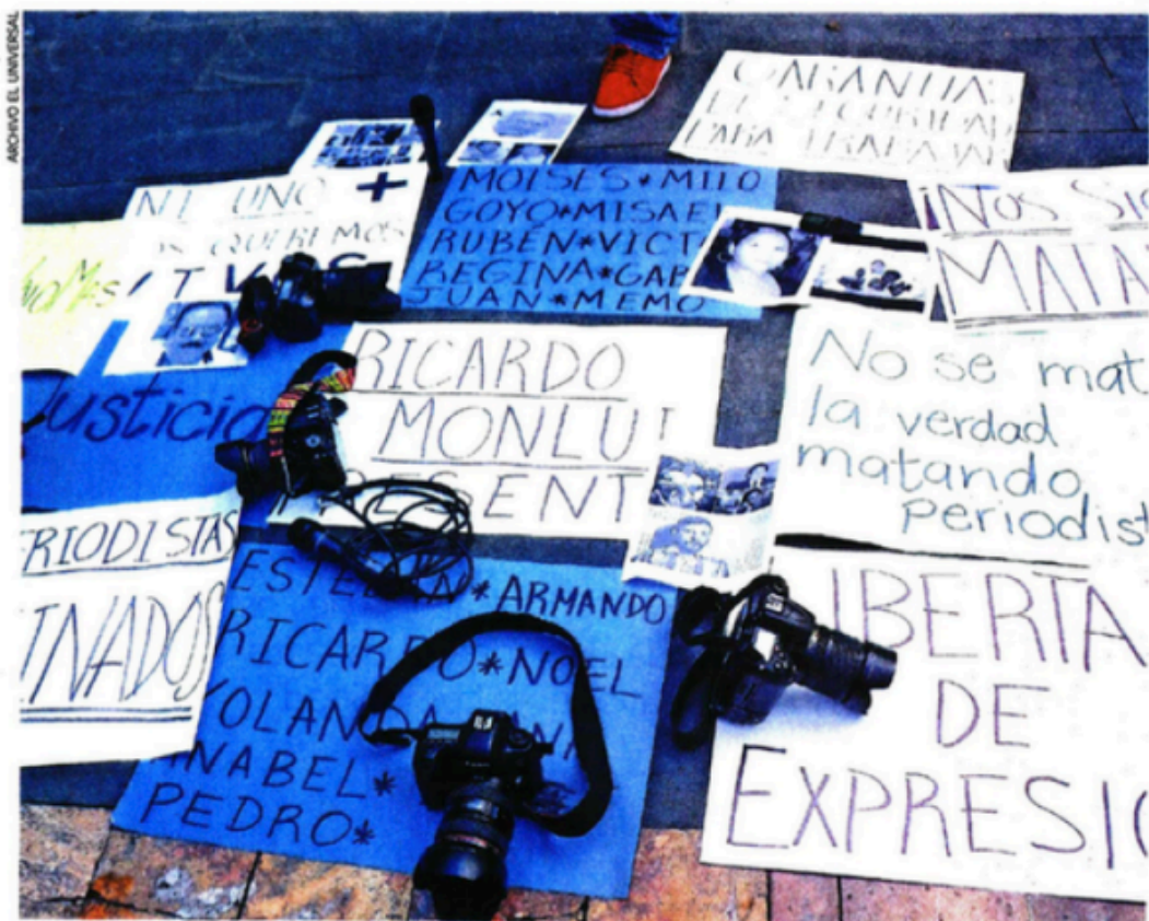
La SIP destacó que México está entre los países con más restricciones estructurales a la libertad de prensa.