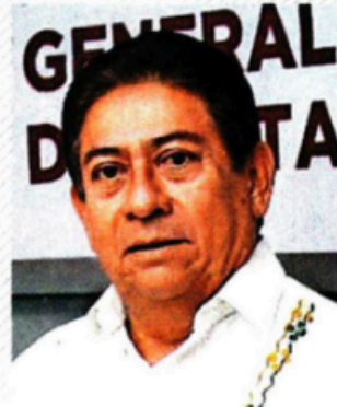
Nicolás Bautista Ovando. Fiscal general del estado.