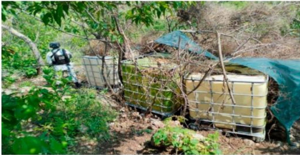
El contrabando fiscal de gasolinas y diésel, también llamado huachicol fiscal, provocó pérdidas para el gobierno federal de 177,170 millones de pesos en el 2024.