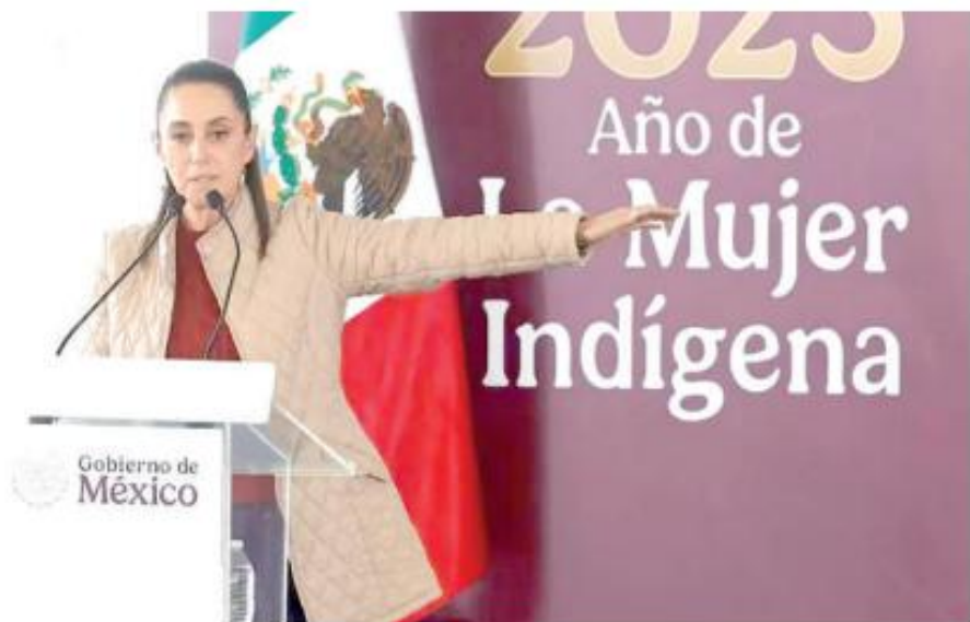
La presidenta Sheinbaum estuvo en la alcaldía Tlalpan. Especial

Desde Tlalpan, Ciudad de México (CDMX), Claudia Sheinbaum expresó que el dinero del pueblo es resultado del cobro de impuestos, mismos que todos pagan. Agregó que había excepciones, dado que hay quienes se niegan a cumplir sus obligaciones fiscales; sin embargo, sostuvo que la justicia siempre triunfa frente a estos casos.