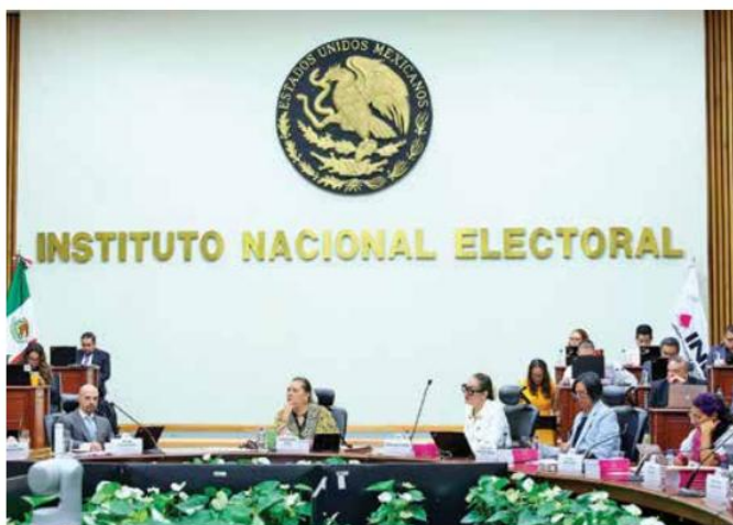
• LIMPIEZA. INE ordenó destruir boletas excepto las que estén en indagación.

El INE y la Conaliteg firmaron un convenio para que la comisión lleve a cabo la recolección de la documentación electoral que el Instituto genere de los Procesos Electorales Federales, y la de otros mecanismos para su posterior destrucción y recepción del papel de desecho en donación, a fin de que sea permutado por la Comisión en papel de reciclaje nuevo. 🗳️