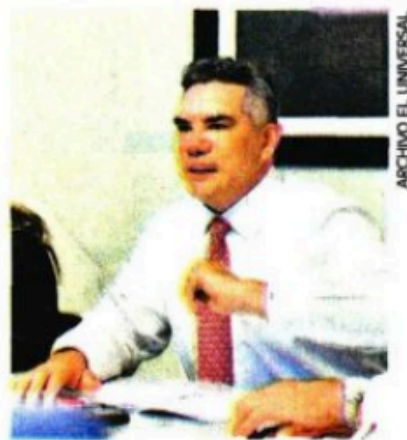
Alejandro Moreno dijo que Morena está destruyendo al país y que es un "narcogobierno".

Reconoció que aunque carece de fundamentos, la acusación en su contra lastima a su persona, pero insistió en que sólo buscan "distracer con lo mismo, pero no tienen nada". ●