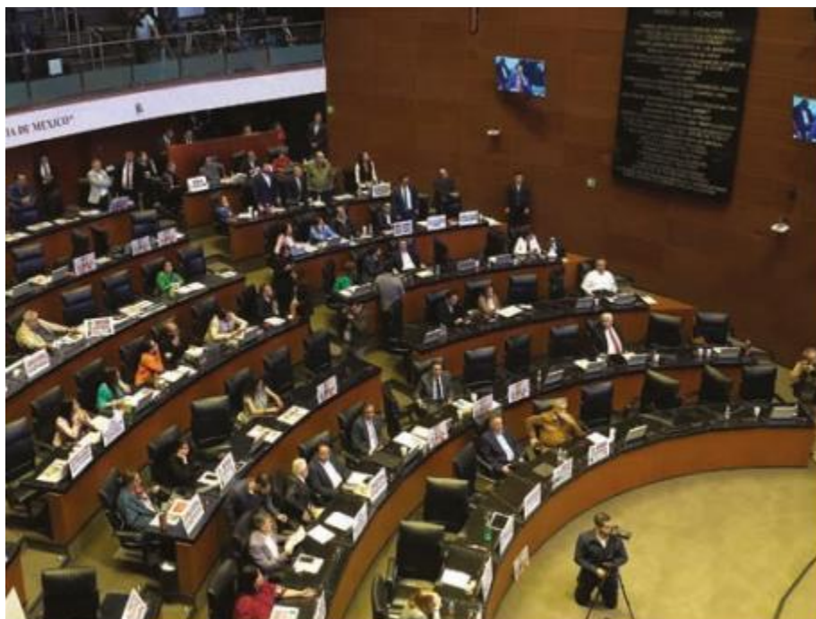
Choque de opiniones de senadores sobre el acuerdo con EU para postergar 90 días la aplicación de aranceles.