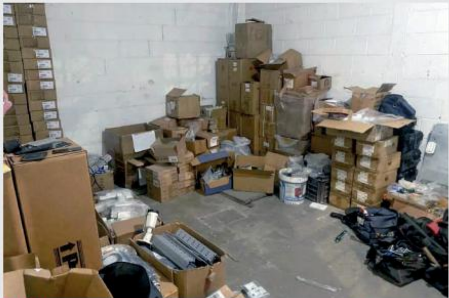
El lugar presuntamente es propiedad de la empresa "ZAVOLI".

Este pasado miércoles 30 de julio, personal del Fuerte de Tierra de la Secretaría de Marina (Semar) acompañó a autoridades municipales y personal de la Fiscalía General de Justicia del Estado de México (FGJEM) para cumplimentar una orden de cateo. Según se sabe, esta fue ejecutada en la colonia Santa Cruz Venta de Carpio, perteneciente al municipio de Ecatepec.