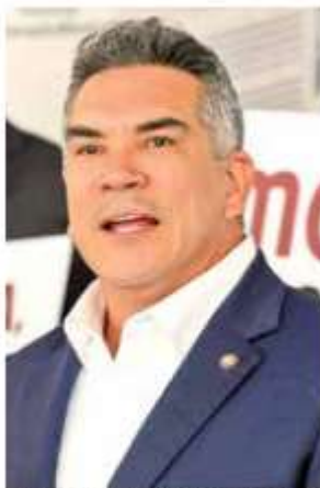
Alejandro Moreno Cárdenas, senador y líder del PRI.

A partir de hoy, la Sección Instructora tendrá un plazo de 60 días para formular el dictamen y poder llevarlo al pleno.