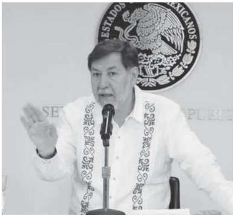
El senador Gerardo Fernández Noroña

ña reconoció que es una interacción “difícil y tensa”, marcada por negociaciones periódicas. Comparó la dinámica con una “relación de pareja en la que uno de los dos no quiere cooperar”.