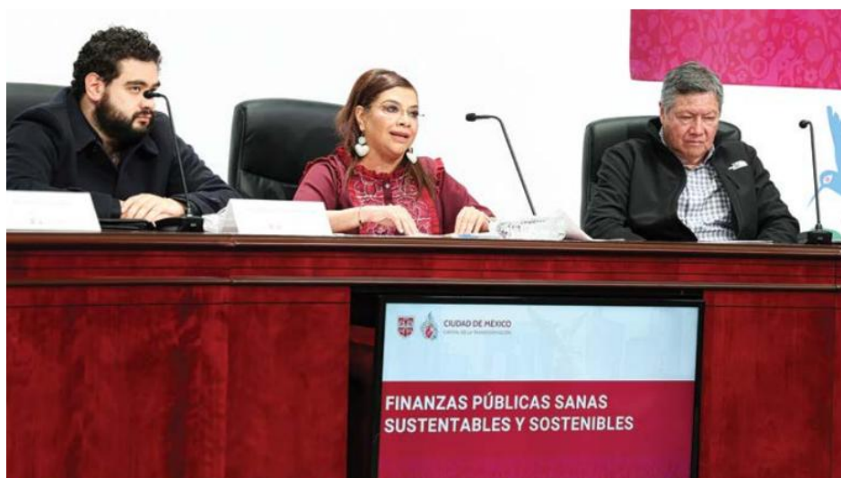
Brugada refirió que el aumento en la recaudación de la capital es una muestra de “una economía que se mantiene estable y en crecimiento”.

En el primer semestre de 2025, la Ciudad de México logró recaudar más del 60 por ciento de los recursos programados en la Ley de Ingresos