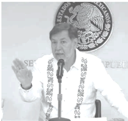
El senador Gerardo Fernández Noroña

Al referirse a la relación con el presidente Donald Trump, Fernández Noro-