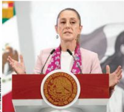
LA PRESIDENTA Claudia Sheinbaum, ayer, en conferencia de prensa.

También consideró que debe ser fortalecida la Unidad de Fiscalización del Instituto Nacional Electoral, para que verifique cualquier recurso que vaya a los partidos políticos.