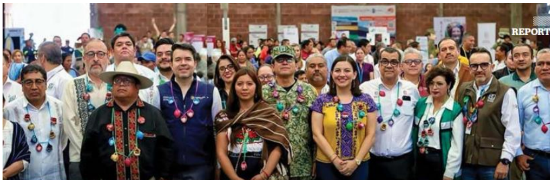
Durante la inauguración se realizó una ceremonia tradicional y la entrega simbólica del lábaro patrio a la Guardia Comunitaria.