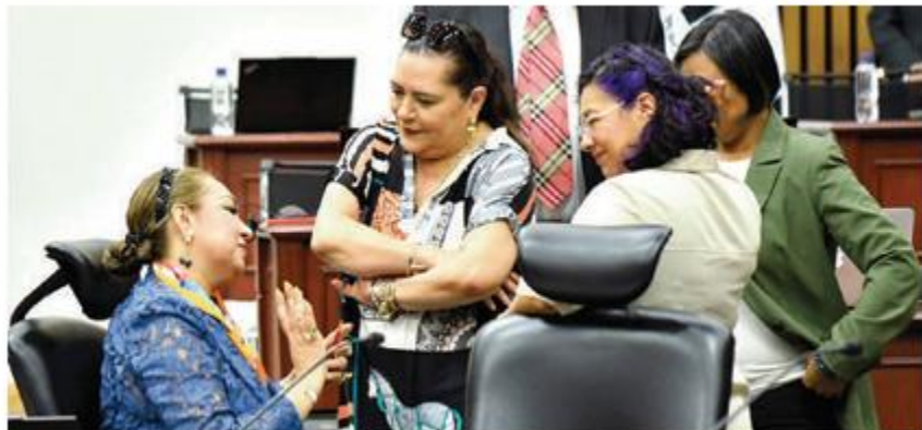
INTEGRANTES del Consejo General del INE, ayer, durante la sesión.