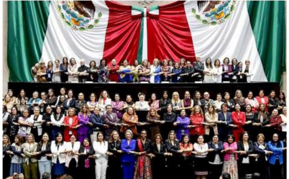
Participantes en el II Foro Parlamentario de América Latina y el Caribe. Especial

Destacó los cambios logrados en las últimas décadas, como la paridad de gé-