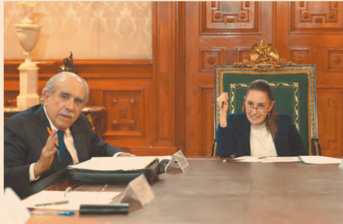
Claudia Sheinbaum Pardo , presidenta de México, aseguró que la participación será lo más amplia posible.

La mandataria mexicana aclaró que no habrá recursos extraordinarios para esta instancia: “Si