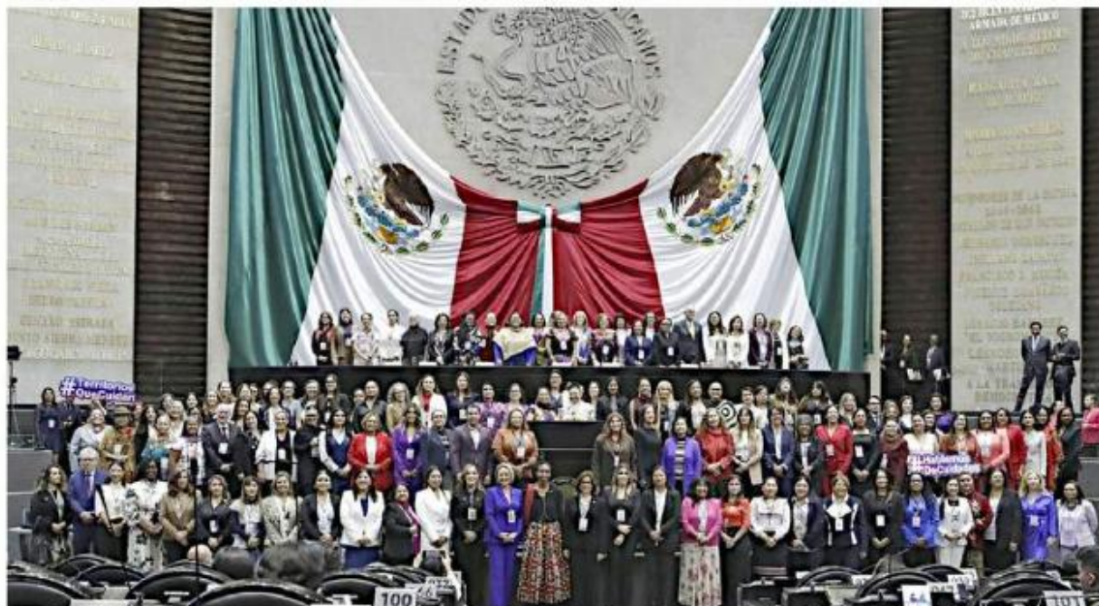
■ En la Cámara de Diputados se inauguró el Foro Parlamentario de América Latina y el Caribe con la presencia de Sima Bahous, directora ejecutiva de ONU Mujeres.

En mayo de este año, el Senado de Chile aprobó un proyecto de ley para crear el Sistema Nacional de Apoyos y Cuidados.