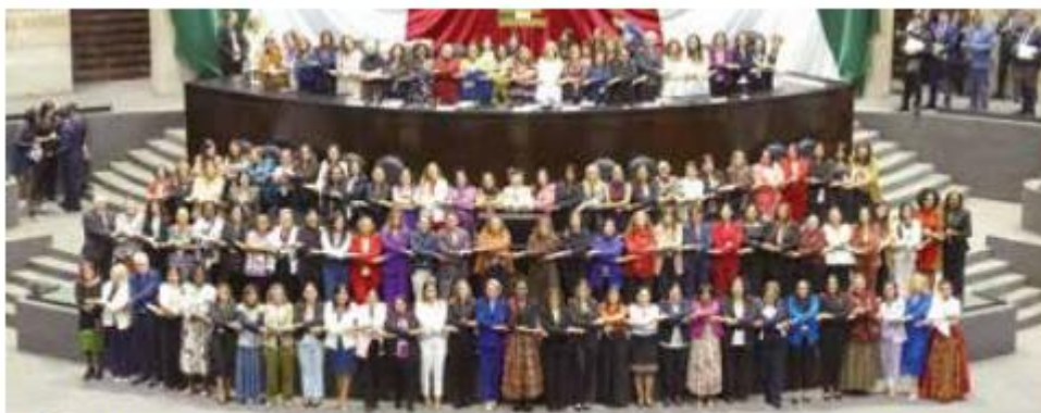
Encuentro. Ayer se inauguró el Foro Parlamentario de América Latina y el Caribe.