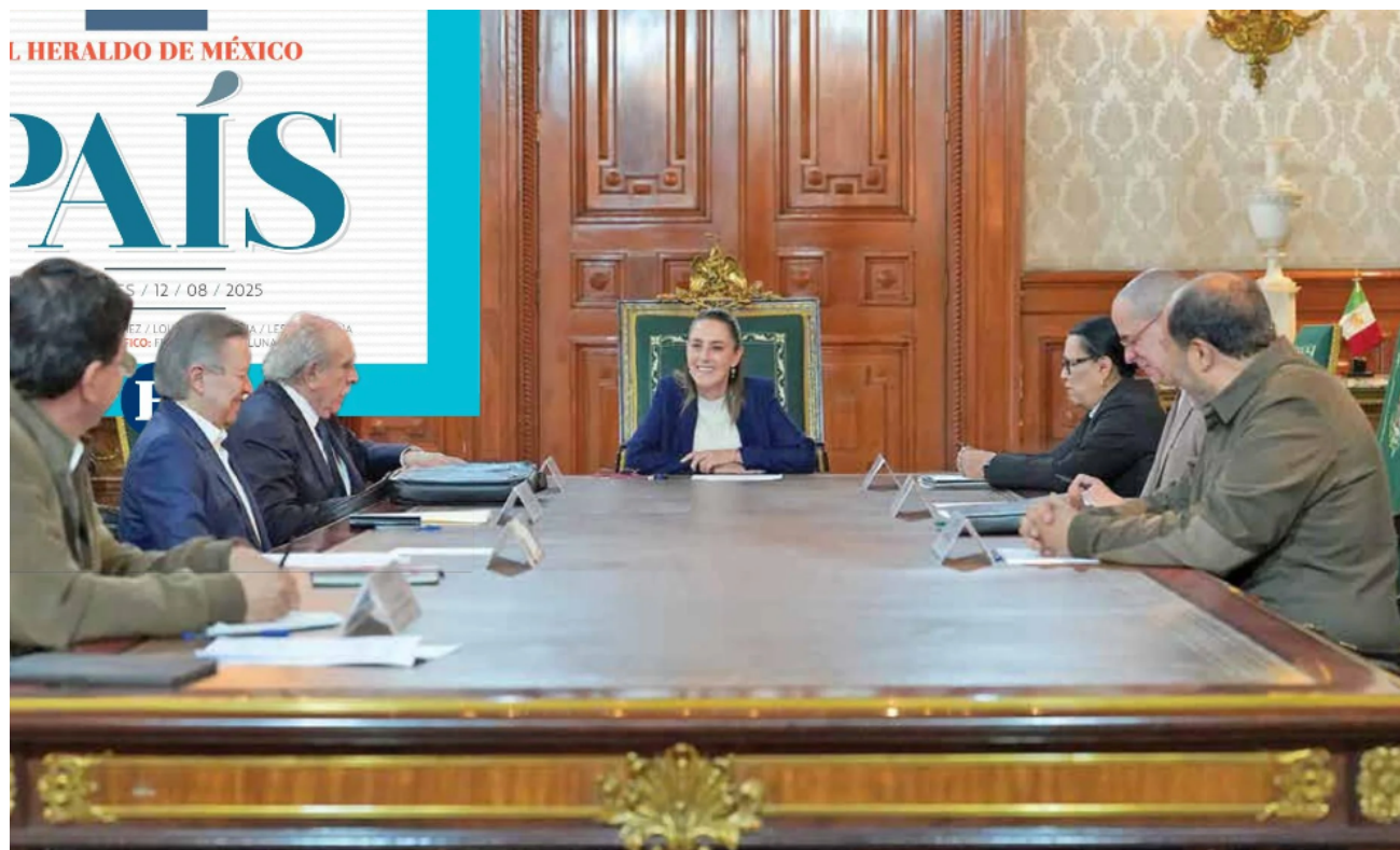
● OBJETIVO. En Palacio Nacional, la presidenta Claudia Sheinbaum dio inicio a los trabajos de la Comisión Presidencial para la Reforma Electoral.