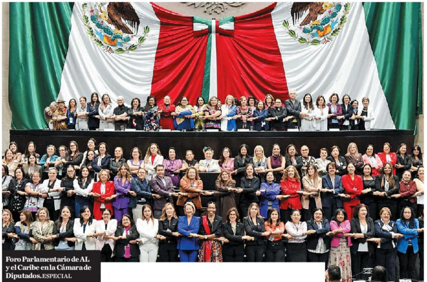
Foro Parlamentario de AL y el Caribe en la Cámara de Diputados. ESPECIAL