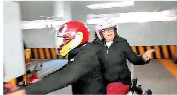
La funcionaria federal a su salida del encuentro.

La 16 Conferencia Regional sobre la Mujer se llevará a cabo a partir de hoy y hasta el 15 de agosto en Ciudad de México. —