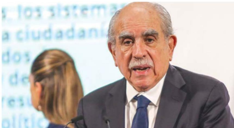
Pablo Gómez Álvarez, titular de la Comisión Presidencial para la Reforma Electoral, participó en la conferencia matutina de la presidenta Claudia Sheinbaum.

Según lo expuesto en la conferencia matutina de la presidenta Claudia Sheinbaum, en los debates públicos se incluirá a la ciudadanía en general, organizaciones sociales y civiles, partidos nacionales y locales, comunidades indígenas, e integrantes de centros de educación superior investigación.