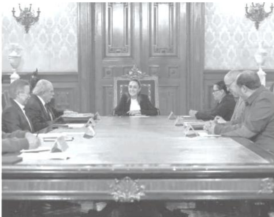
Claudia Sheinbaum con los integrantes de la Comisión Presidencial

de Asesores del Presidente de la Oficina de la Presidencia, Jesús Ramírez Cuevas, y el coordinador general de Política y Gobierno de la Oficina de la Presidencia, Arturo Zaldívar.