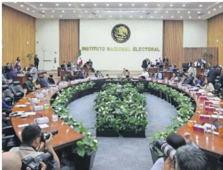
Una vez que se avale, el proyecto de presupuesto pasará al Consejo General del INE para su aprobación el próximo 18 de agosto.

En la distribución por áreas, el monto más alto es para la Dirección Ejecutiva de Administración, con mil 603 millones de pe-