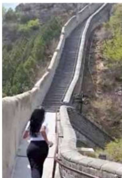
Captura. Video de la diputada Sandra Anaya corriendo en la gran muralla.