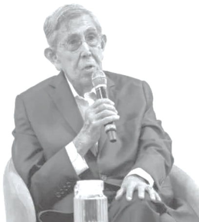
Cárdenas inauguró clases del TEC Campus Toluca