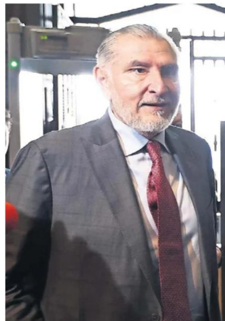
En la Comisión Permanente se presentó un punto de acuerdo para que López Hernández comparezca.