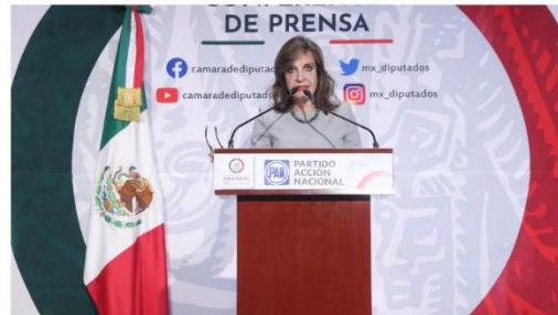
La diputada panlista pidió seguir indagando sobre este caso (Cámara de Diputados)

La diputada del Partido Acción Nacional , María Elena Pérez-Jaén Zermeño , propuso un punto de acuerdo para solicitar la comparecencia del general Audomaro Martínez Zapata , exdirector del Centro Nacional de Inteligencia , ante las Comisiones Unidas de Seguridad Ciudadana y de la Defensa Nacional.