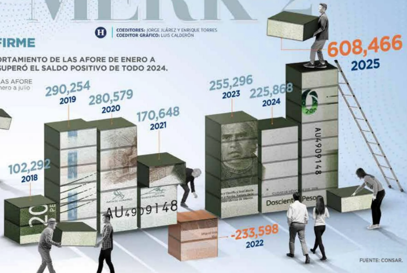
GRÁFICO: NELLY VEGA

AFORE OPERAN EN EL SECTOR DE AHORRO PARA EL RETIRO EN EL PAÍS.