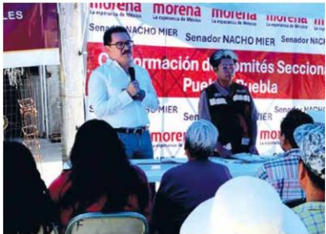
Labor. El senador por Puebla Ignacio Mier encabezó la asamblea de ayer.

Explicó que cada domingo se efectuarán diversas asambleas en distintas partes del país y que la