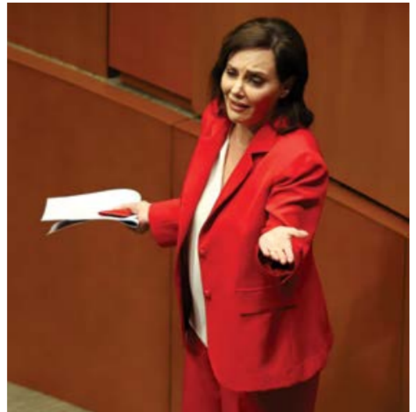
Lilly Téllez acusó a Adán Augusto López Hernández de ser 'líder político del cártel de La Barredora'

Su acusación se centró en que los "narco políticos" deben rendir cuentas, y advirtió que no dará tregua hasta que haya legalidad y transparencia.