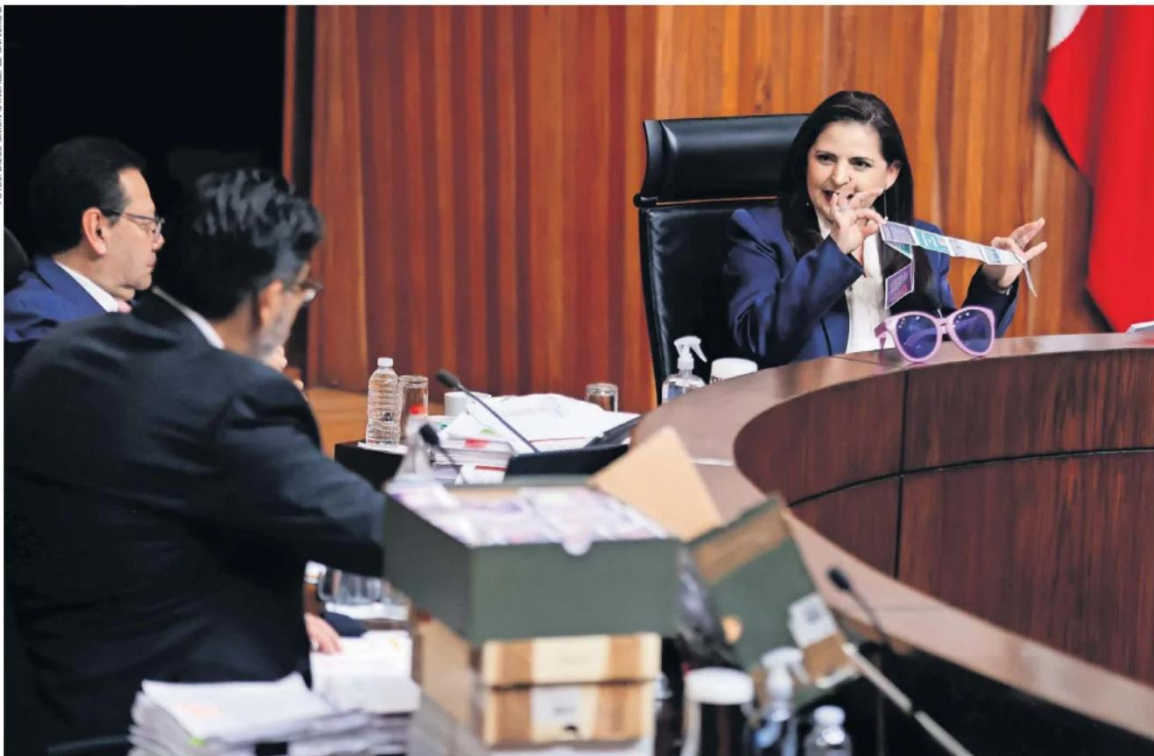
Mónica Soto, magistrada presidenta del TEPJF, cuestionó cómo se podría comprobar que esas listas fueron determinantes en el resultado de la elección.

“El proyecto subestima la inteligencia ciudadana. ¿O acaso los 13 millones de personas que votaron son ovejas, ciegas, sordas y acriticas?”