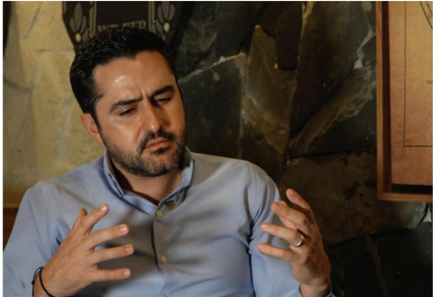
El senador panista Agustín Dorantes Lámbarri, en entrevista con La Crónica de Hoy .

“No, a lo largo del tiempo hemos visto como el queretano es muy inteligente y sofisticado al momento de decidir su voto”, confía.