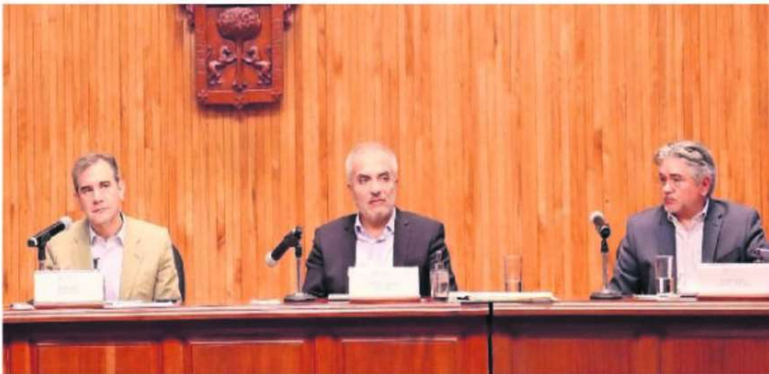
Lorenzo Córdova, Luis Carlos Ugalde y Leonardo Valdés durante un foro para defender la democracia.