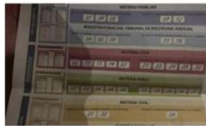
Arriba: la gobernadora Maru Campos; abajo, un acordeón chihuahuense y, a la derecha de estas líneas, el magistrado electoral Reyes Rodríguez mostrando otra versión de estos materiales que circularon en el país