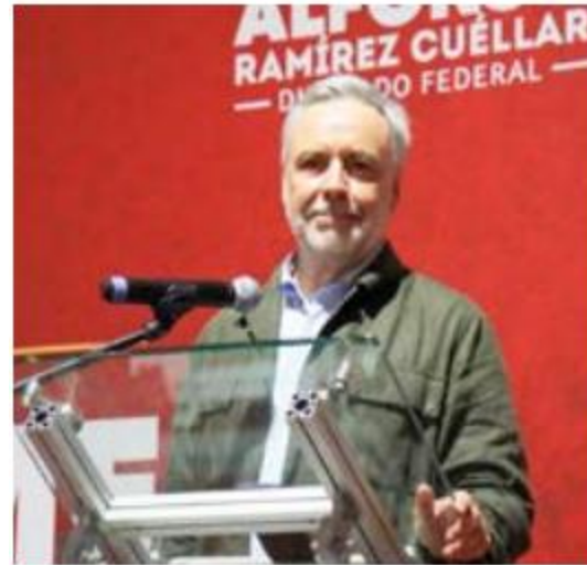
META. El diputado señaló que buscan integrar recursos con criterios ambientales y de equidad territorial.

da para el Bienestar contempla 12 mil 400 acciones a lo largo del sexenio, entre ellas, cuatro mil 500 viviendas nuevas para derechohabientes del Infonavit, seis mil apoyos para no derechohabientes por medio de Conavi y la entrega de mil 500 escrituras a cargo del Insus. /VALINARUIZ