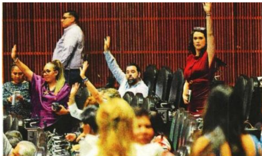
Legisladores , durante una votación en la cámara.