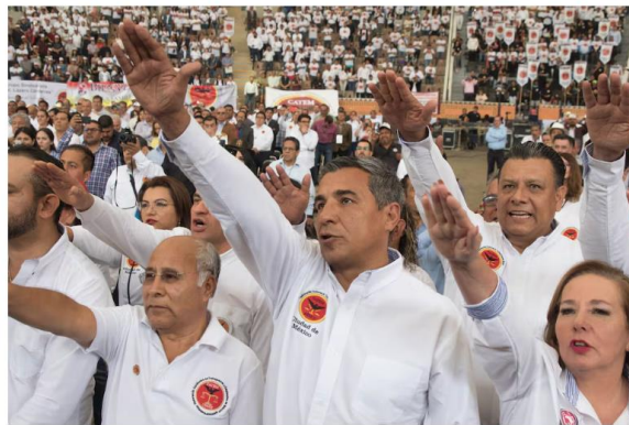
Dirigentes de la Confederación Autónoma de Trabajadores y Empleados de México, en Ciudad de México, en abril de 2018.

El político asegura que es una campaña de difamación. En documentos de inteligencia filtrados por el colectivo Guacamaya se describe la relación de algunos agremiados de alto nivel con estructuras criminales