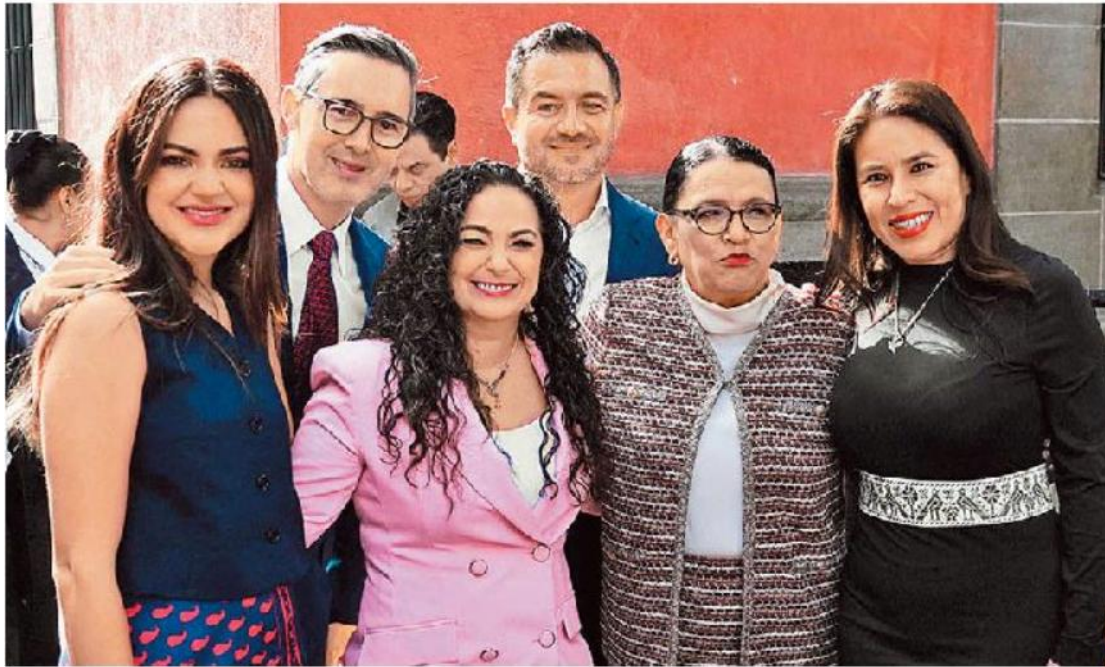
La titular de Gobernación acudió a reunión del partido en Xicoténcatl.