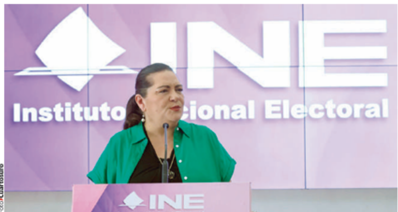
GUADALUPE TADDEI, consejera presidenta del INE, ayer, en conferencia de prensa.

» CONSEJERA PRESIDENTA asegura que no hay "amenazas" detrás del acercamiento con la comisión presidencial; la oposición vislumbra un intento de "subordinación institucional"