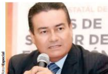
EL EXSECRETARIO de Educación de Sonora, en imagen de archivo.