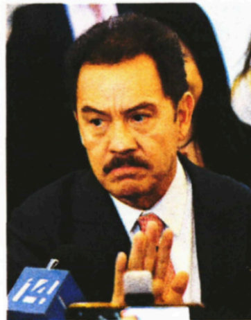
Ignacio Mier , vicecoordinador de Morena en el Senado.

“En términos políticos es más grave lo que se le señala por actos de corrupción en Campeche”, señaló Mier.