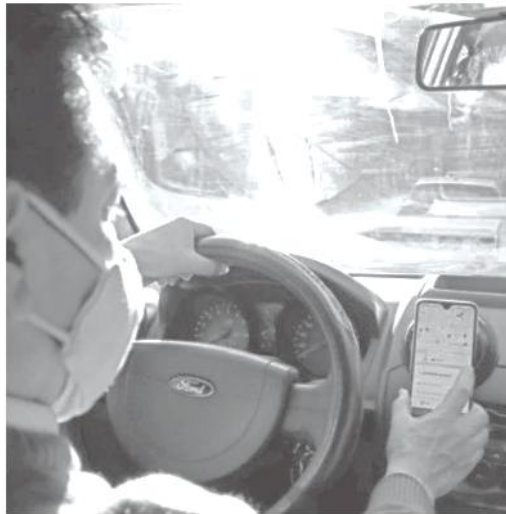
Con la reforma se ataca el vacío regulatorio en la seguridad y protección de las y los pasajeros

Con la reforma aceptada se deja asentado que el servicio de transporte privado con chofer que opere mediante plataformas digitales deberá cumplir con herramientas digitales accesibles, tarifas claras y transparentes, opciones de pago electrónico y en efectivo, protección de datos personales, certificación periódica de conductores y accesibilidad para personas en situación de vulnerabilidad.