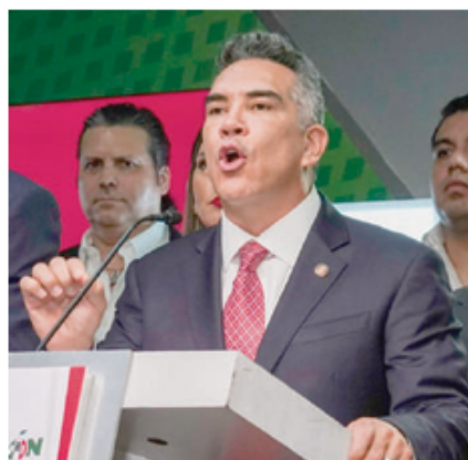
EL LÍDER nacional del PRI, Alejandro Moreno, ayer, en conferencia de prensa.

EL DIRIGENTE del PRI acusa al presidente de la Cámara alta de faltar de forma recurrente a acuerdos; su modus operandi es amedrentar, provocar y presionar a otros legisladores, añade; señala “montaje” de Morena