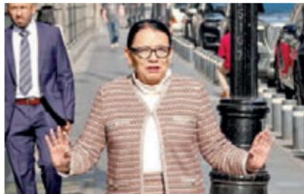
Rosa Icela Rodríguez condenó cualquier tipo de agresión.

En el marco de la plenaria del grupo parlamentario de Morena en el Senado