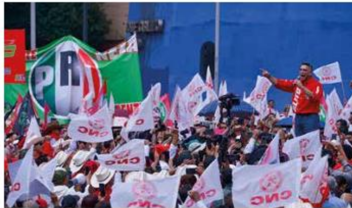
Apoyo. La Confederación Nacional Campesina manifestó su respaldo a Alito.

El priista presentó una denuncia ante la FGR por “amenazas de muerte” de Noroña