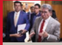
Fallaron los morenistas.