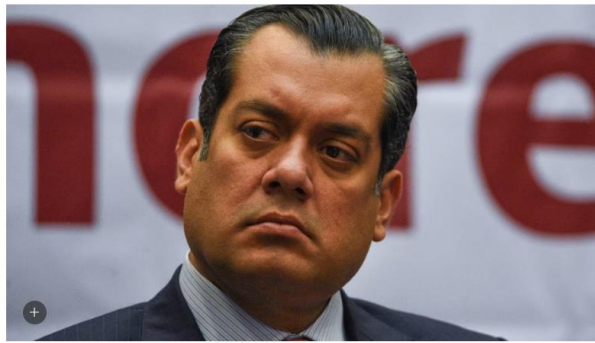
El diputado federal de Morena Sergio Gutiérrez Luna

Por acuerdo de la Jucopo, el actual presidente de la Cámara de Diputados continuará unos días más y recibirá el Informe de Claudia Sheinbaum.