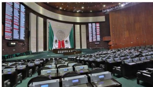
La mesa directiva convocó a sesión el 1 de septiembre de 2025 a las 17:00 horas

La Cámara de Diputados quedó instalada para el inicio de las actividades del segundo año legislativo sin la conformación de una nueva Mesa Directiva . La Junta de Coordinación Política ( Jucopo ) no alcanzó el acuerdo para la integración del organismo, por lo que el encabezado por Sergio Gutiérrez Luna funcionará hasta el próximo 5 de septiembre de 2025.