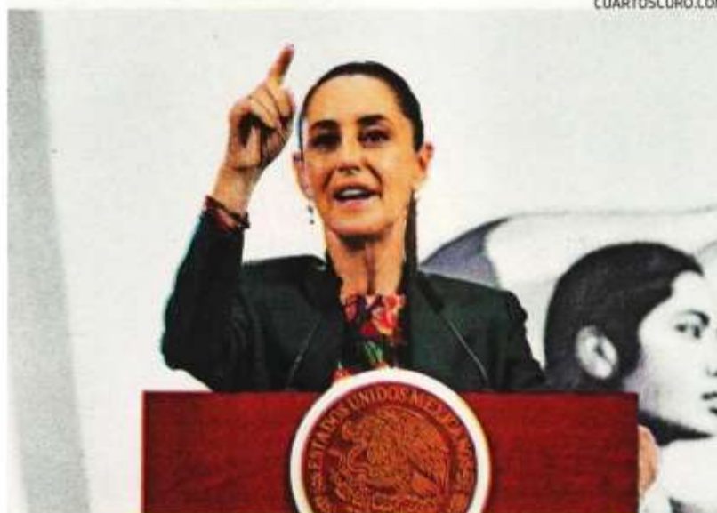
La presidenta Claudia Sheinbaum, en conferencia de prensa.