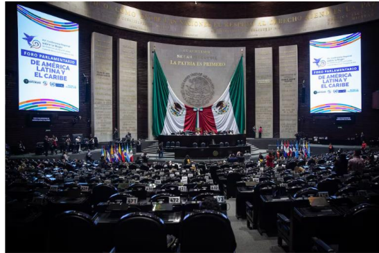
Foto de la Cámara de Diputados. A.L. De Agence ANDREA MURCIA MONTEALÍ (CARTOONIST)

El Congreso mexicano arranca este lunes un nuevo periodo de sesiones que avanzará al ritmo de las prioridades de la presidenta, Claudia Sheinbaum, y del partido gobernante, Morena. Las encomiendas que tienen de frente los legisladores oficialistas no son menores. El paquete económico marcará la hoja de ruta del segundo año de Gobierno de la mandataria, indispensable para cumplir con los objetivos de su Administración; así como una serie de reformas constitucionales y legales que darán el pistoletazo a su cruzada para combatir el delito de extorsión , cuyos índices no han podido anunciar a la baja. Los ciudadanos son víctimas de amenazas todos los días: los comercios, los servicios y el transporte se ven obligados a pagar cuotas criminales para trabajar. Combatirlo requiere reformas a la Constitución, en materia de extorsión, en el Código Nacional de Procedimientos Penales y en la ley Contra la Delincuencia Organizada. Junto con otro puñado de cambios legales, entre ellas la reducción gradual de la jornada laboral de 45 a 40 horas, serán las prioridades en los tres meses del nuevo periodo de sesiones.