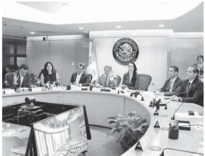
Aspectos de la reunión de la JUCOPO en Cámara de Diputados