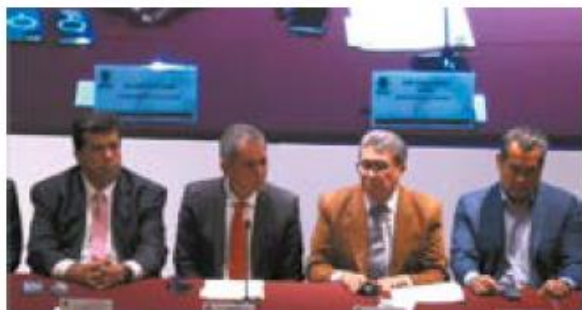
Reunión. El titular de Hacienda con legisladores de Morena.