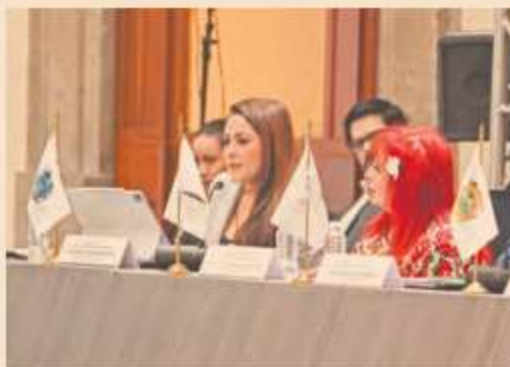
La gobernadora de Aguascalientes, Tere Jiménez, participó en la 51 Sesión Ordinaria del Consejo Nacional de Seguridad Pública.

compromiso y trabajo que realizan las y los gobernadores en sus respectivos estados, para sumar a la Estrategia Nacional de Seguridad Pública.