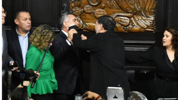
CIUDAD DE MÉXICO, 27AGOSTO2025 - Conato de bronca entre Alejandro Moreno Cárdenas, y Gerardo Fernández Noroña, presidente de la mesa directiva, al finalizar la última sesión ordinaria de la Comisión Permanente, en la que se discutió la agenda política en referencia a los dichos de Lilly Téllez, senadora del PAN quien solicitó en una entrevista la intervención militar de los Estados Unidos para combatir al narcotráfico en México.

La Fiscalía General de la República (FGR) programó para este viernes 5 de septiembre una diligencia clave en la antigua sede del Senado de la República, en Xicoténcatl, Ciudad de México , donde se realizará una reconstrucción de los hechos en torno al altercado físico entre Gerardo Fernández Noroña y Alejandro "Alito" Moreno Cárdenas . Este ejercicio procesal se centra en los incidentes ocurridos el pasado 27 de agosto al final de la última sesión ordinaria de la Comisión Permanente.