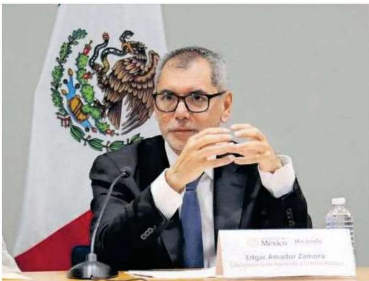
El titular de Hacienda entregará el presupuesto el 8 de septiembre

Según el economista en jefe de VALMEX, aunque el gasto federal enfrenta restricciones, todavía existe espacio para optimizar recursos y generar ingresos adicionales sin una reforma fiscal. Subrayó que los ajustes probables y deseables se concentran en tres áreas: gasto operativo, subsidios y transferencias no focalizados e inversión pública. "El PEF 2026 debería proteger gasto social y salud mediante eficiencia y focalización".