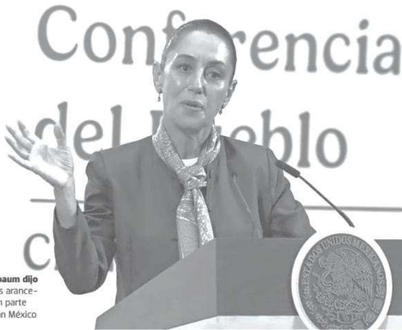
Sheinbaum dijo que los aranceles son parte del Plan México

66 CLAUDIA SHEINBAUM PRESIDENTA DE MÉXICO