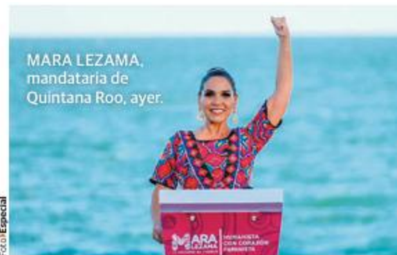
MARA LEZAMA, mandataria de Quintana Roo, ayer.

LA GOBERNADORA de Quintana Roo cumple tres años de gobierno; convoca a defender lo alcanzado. pág. 14