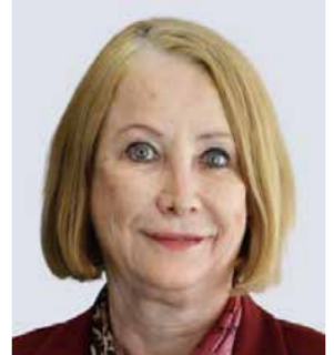
Laura Itzel Castillo Juárez, presidenta de la Mesa Directiva del Senado, dijo que tendrán un papel clave en el análisis del paquete.

Durante la conversación, la senadora también reconoció los avances alcanzados por las mujeres en el ámbito político nacional. Destacó que hoy existe paridad de género en ambas cámaras del Congreso de la Unión, un logro que refleja décadas de