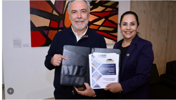
El diputado de Morena, Alfonso Ramírez Cuéllar.

Se propone la derogación de la legislación sobre asociaciones público-privadas (APPs) para superar las limitaciones de inversión anteriores, que se concentraban en autopistas y energía.