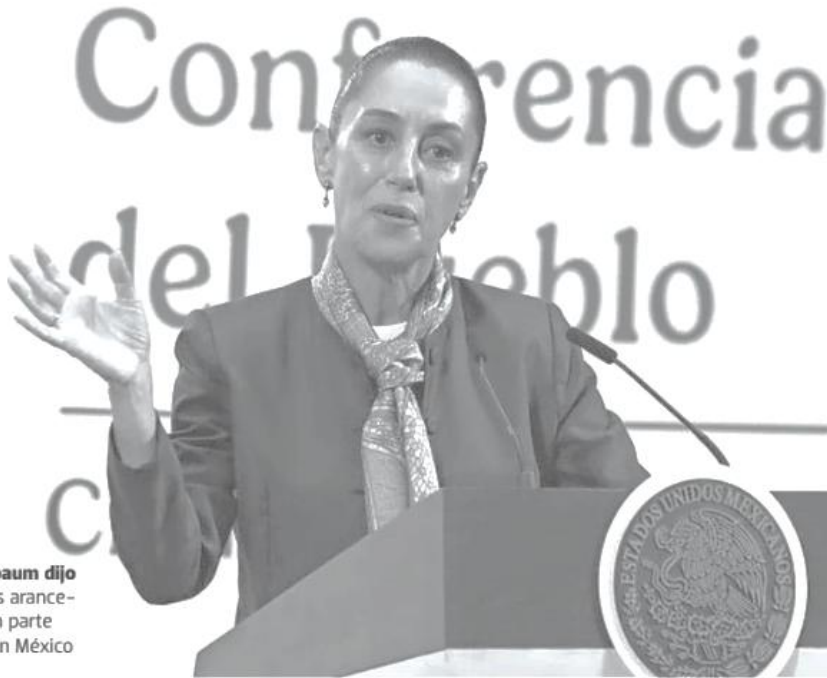
Sheinbaum dijo que los aranceles son parte del Plan México