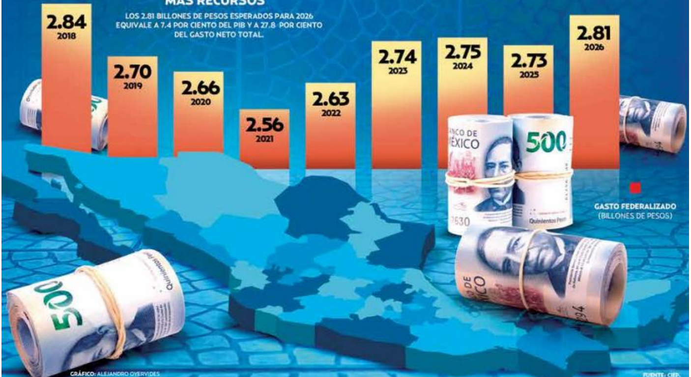
GRÁFICO: ALEJANDRO DYERVIDES

LOS 2.81 BILLONES DE PESOS ESPERADOS PARA 2026 EQUIVALE A 7.4 POR CIENTO DEL PIB Y A 27.8 POR CIENTO DEL GASTO NETO TOTAL.