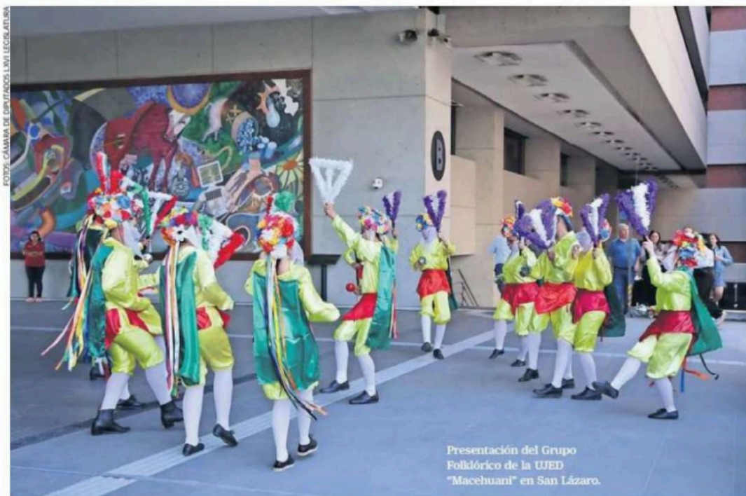
Presentación del Grupo Folklórico de la UED "Macehuani" en San Lázaro.

Aunque en su mayoría son de la bancada de Morena, los 20 integrantes de esta Comisión no han dado resultados: Pocas iniciativas y ninguna nueva ley aprobada