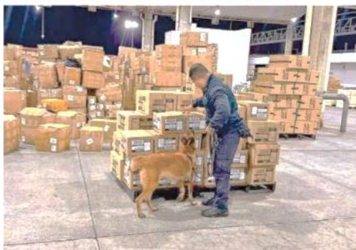
Los pequeños comerciantes serán los perdedores de esta reforma fiscal