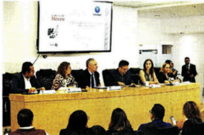
■ Especialistas ayer en el Foro sobre Impuestos Saludables.

de la sociedad civil criticaron que la estrategia se base en el aumento a los precios y no exista una política de educación física en las escuelas.