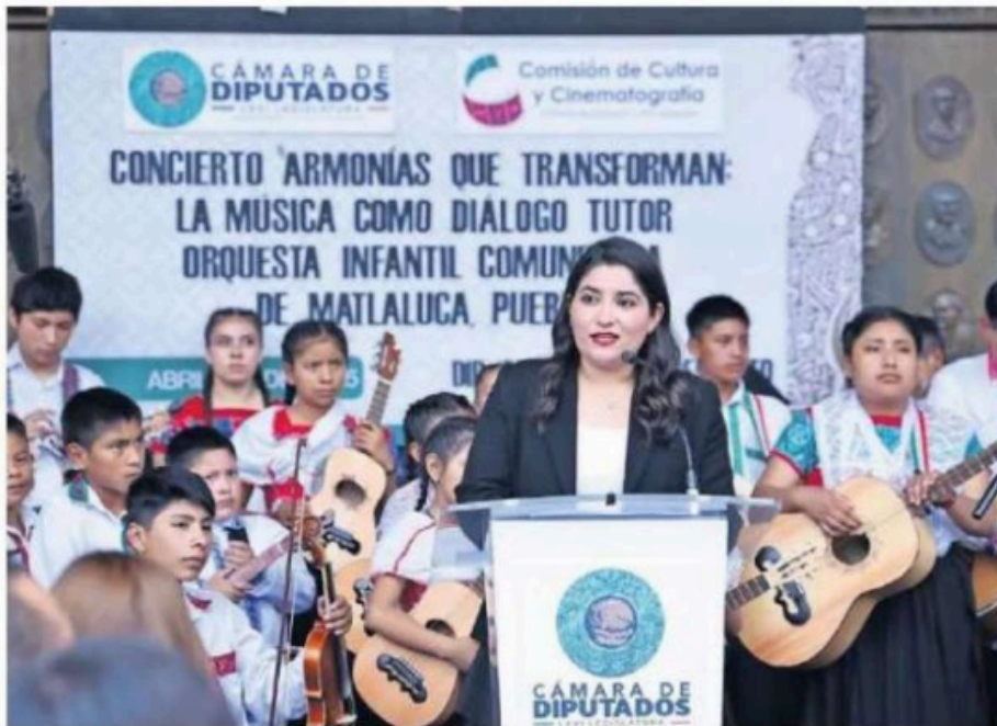
Otra de las actividades de la Comisión fue el concierto Armonía Comunitaria.