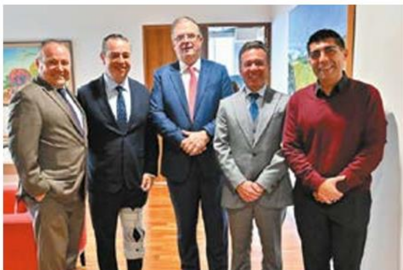
Hecho en México. El secretario de Economía firmó un convenio con Amazon.