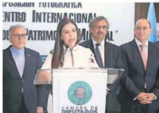
A finales de marzo, la Comisión de Cultura y Cinematografía hizo el Encuentro Internacional Ciudades Patrimonio Mundial, en el Palacio Legislativo para abordar retos en materia de turismo y cultura.