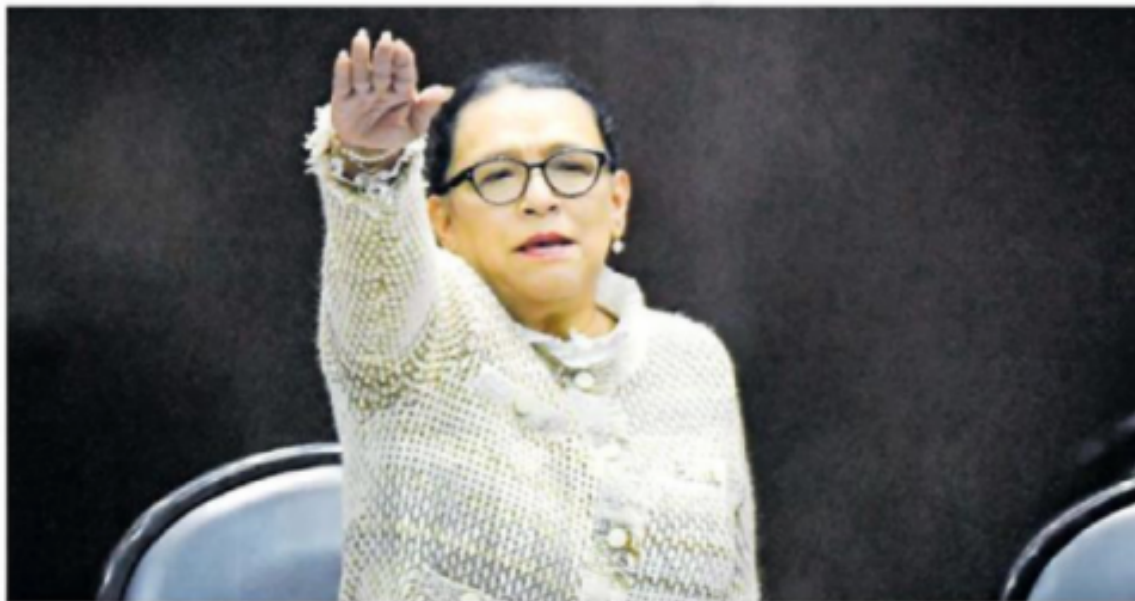
La secretaria de Gobernación, Rosa Icela Rodríguez, ayer.