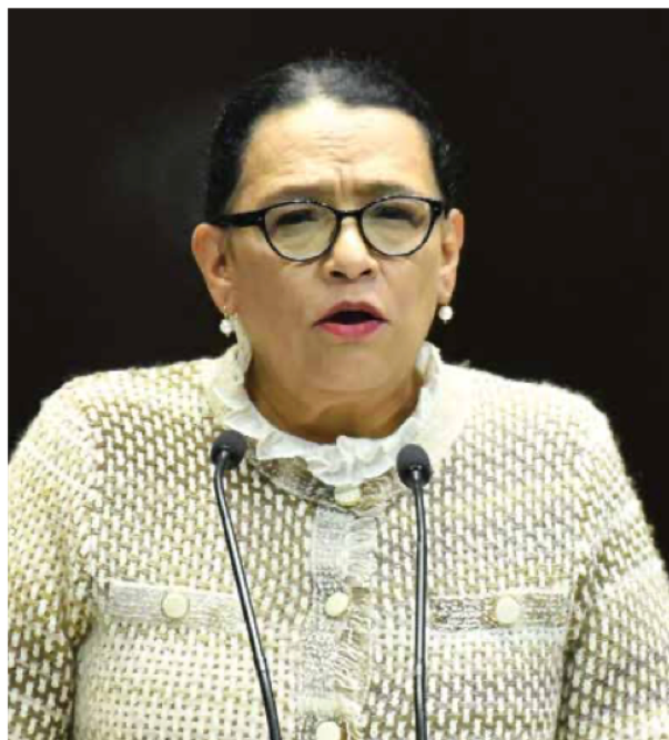
Rosa Icela Rodríguez compareció ante el pleno de la Cámara de Diputados con motivo del Primer Informe de Gobierno.

La secretaria de Gobernación dijo que ‘tuvimos mucho presidente y hoy tenemos mucha presidenta’ y rechazó cualquier calificativo que busca dañar la vida pública