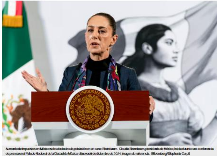
Aumento de impuestos en México sólo afectará a la población en un caso: Sheinbaum. Claudia Sheinbaum, presidenta de México, habla durante una conferencia de prensa en el Palacio Nacional de la Ciudad de México, el jueves 5 de diciembre de 2024. Imagen de referencia.

La presidenta señaló que el incremento del impuesto a los refrescos busca promover un menor consumo por motivos de salud.