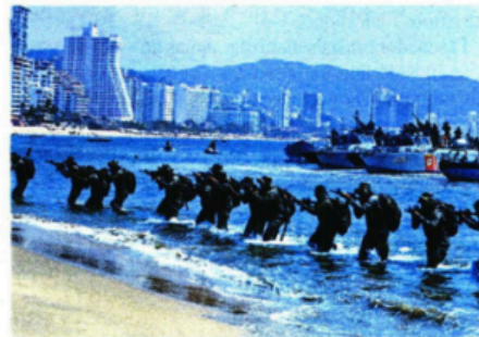
Integrantes de la Marina, en una exhibición en Acaapulco.

Con 344 votos a favor y 127 en contra fue avalada esta ley y fue remitida al Senado para su discusión. El objetivo de la legislación es adecuar puntos relativos a reestructuración de los niveles de mando, actualización de capacidades navales operativas, estratégicas, tecnológicas y de ciberseguridad; consolidación de la Autoridad Marítima Nacional y la armoniza-