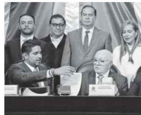
Sesión de la entrega de la Cuenta Pública 2023

El segundo lugar de expedientes con más dinero sin comprobar lo ocupa el exgobernador de Oaxaca, Alejandro Murat. La auditoría 2019-E-20005-19-1473-2020 señala