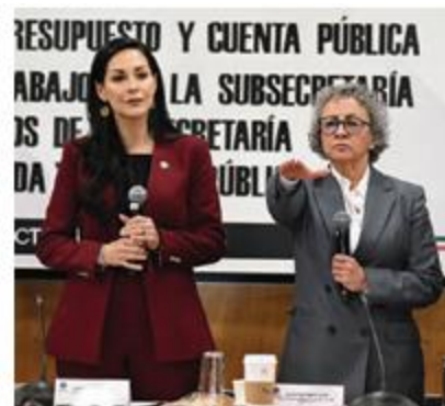
BERTHA GÓMEZ (der.), subsecretaria de Egresos, ante Diputados, ayer.

Agregó que el llamado es crear un fondo de salud, que esté etiquetado de los fondos adicionales que salgan del impuesto a bebidas azucaradas, para recaudar alrededor de 80 mil millones de pesos."