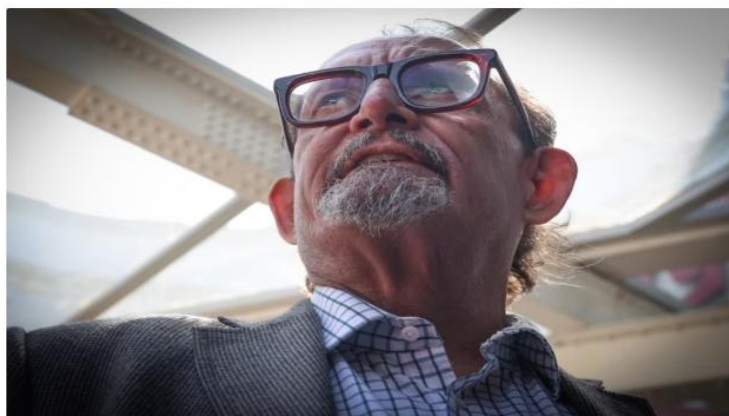
Cuenta con más de 25 años en el servicio público, su trayectoria combina eficiencia administrativa y visión moderna