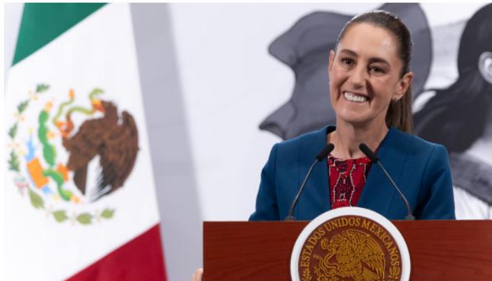
Sheinbaum indicó que el impuesto al refresco es el único que podría afectar la economía de los mexicanos.

La presidenta Claudia Sheinbaum Pardo aseguró que la Ley de Ingresos 2026 , que recientemente fue aprobada en la Cámara de Diputados y remitida al Senado de la República, no contempla nuevos impuestos para la ciudadanía; sin embargo, indicó que hay actualizaciones en los montos.