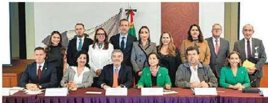
Reunión del canciller De la Fuente con legisladores.

“Dentro de una diversidad de temas que incluyen medio ambiente, migración, inclusión y equidad, entre otros, destaca el Acuerdo Global Modernizado que se espera sea ratificado el próximo año. El canciller también recibirá a los legisladores europeos cuando arriben a la Ciudad de México, a partir del 27 de octubre”, agregó. ■