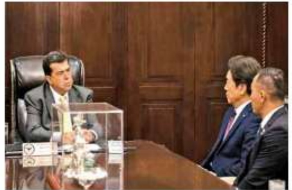
Responsable de la publicación: Elizabeth Bravo