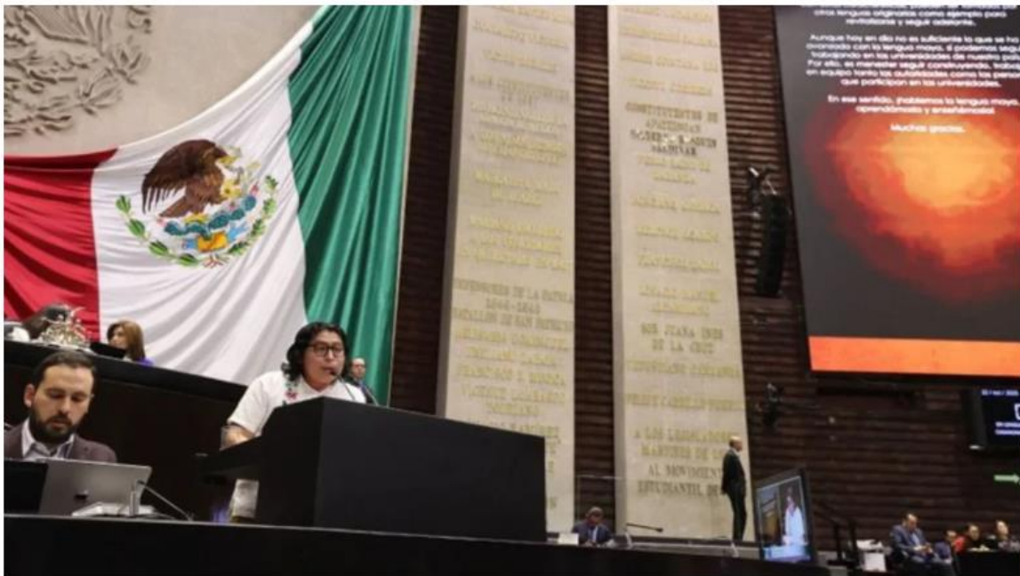
Cámara de Diputados |

“Pregúntenle ahí a la presidenta de Acapulco , con 900 millones de pesos , la refinería de Dos Bocas , que ni refina, pero en cambio sí tiene un déficit de 141 millones de pesos que no está transparentando. El Tren Maya, con un sobrecosto de 115%, casi 4 mil millones de pesos más. De ahí es donde salen las irregularidades”, añadió.