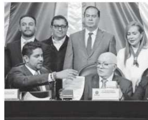
Sesión de la entrega de la Cuenta Pública 2023

Sólo faltará la entrega de una Cuenta Pública de la administración de AMLO