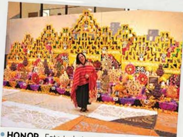
• HONOR. Este trabajo se llama Peldaños y torbellinos entre los altares para su memoria.

se montan en cada casa de las poblaciones rurales de México.