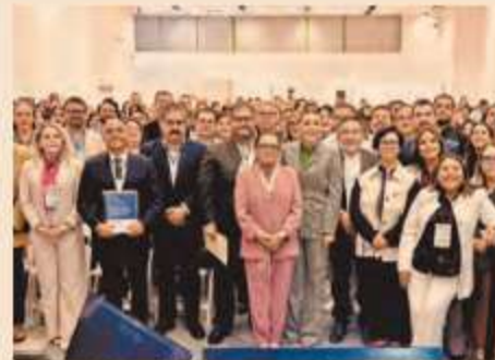
La presidenta Sheinbaum estableció la Comisión Presidencial para la Reforma Electoral, cuya misión es realizar audiencias para escuchar.

"Nunca antes se había considerado a la población para integrar una reforma