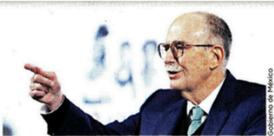
Gobierno de México