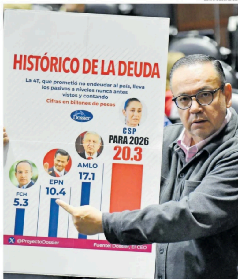
El diputado Germán Martínez Cázares, durante el debate previo en San Lázaro.