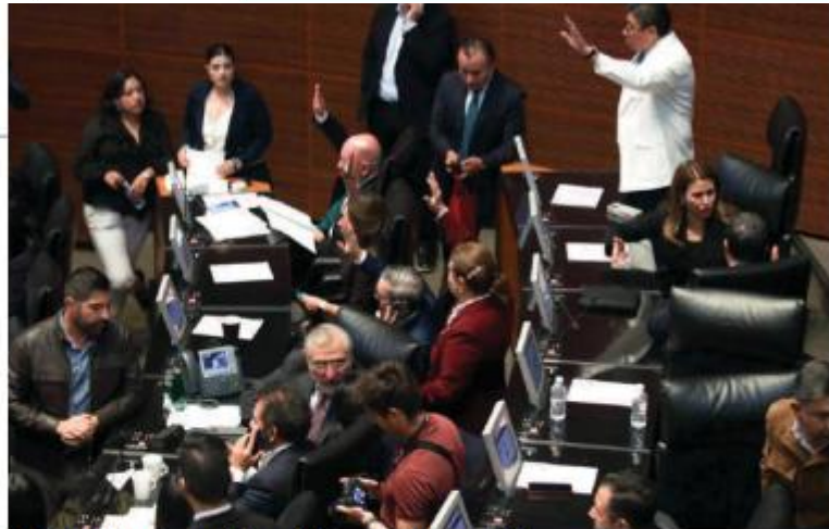
VOTACIÓN, ayer, en el pleno del Senado de la República.