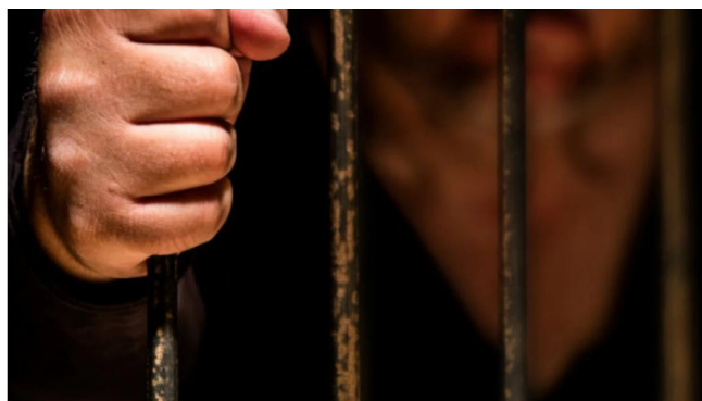
Cámara de Diputados aprueba en lo general y particular Ley General contra la Extorsión. Redes sociales

Tras una larga sesión, el documento fue avalado con 339 votos a favor, 100 en contra y 4 abstenciones, y ahora pasa al Senado de la República para su revisión.