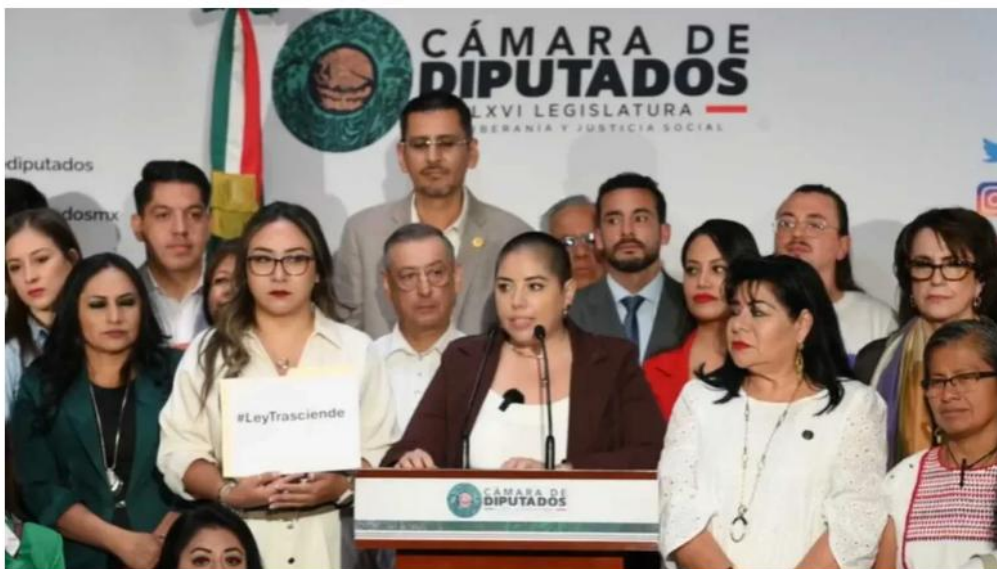
Diputadas presentaron ante el pleno de San Lázaro la 'Ley Trasciende'.