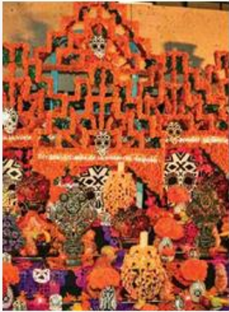
● Honrando a quienes ya no están.