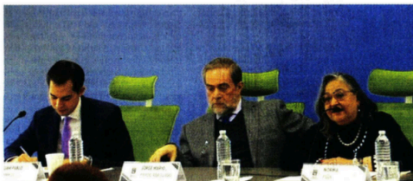
Los Ministros en retiro Jorge Mario Pardo Rebolledo (centro) y Norma Piña participaron en un foro en la UNAM sobre la independencia judicial.

“A mi juicio fue la tormenta perfecta. En otros países, en Perú, en Costa Rica, en