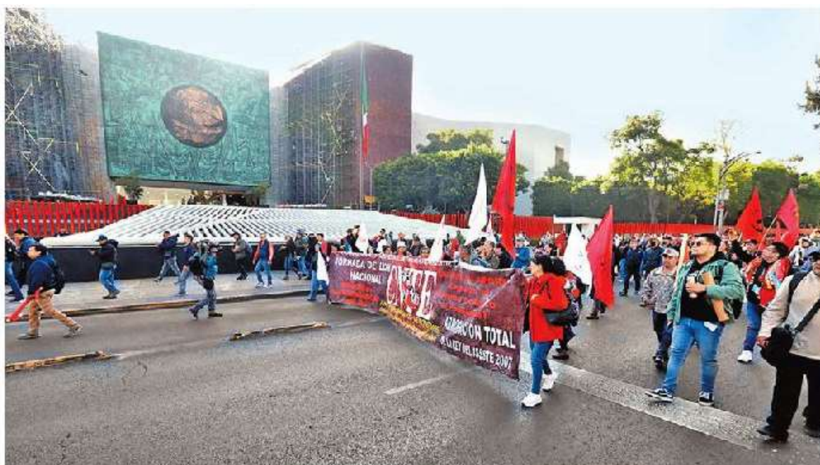
Forcejeo afuera de Palacio y marcha a la Cámara de Diputa- dos.