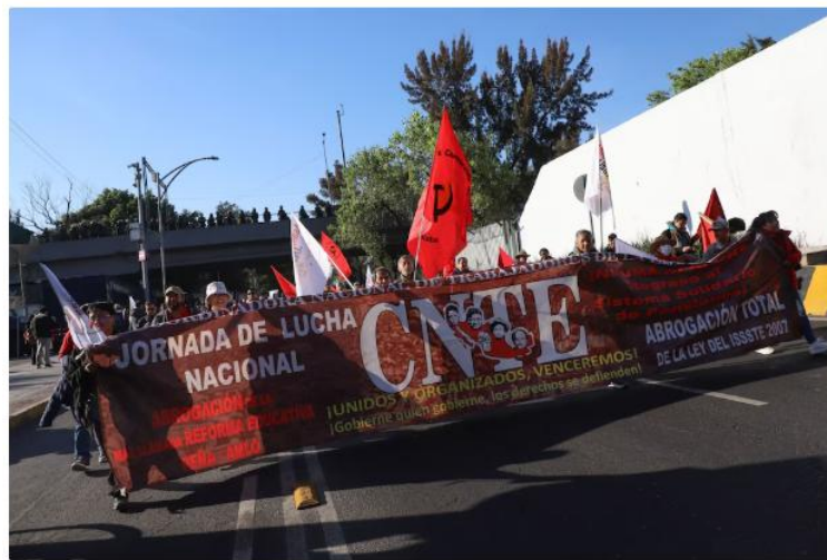
La CNTE se plantó en las inmediaciones de San Lázaro.

La Coordinadora Nacional de Trabajadores de la Educación (CNTE) instaló un plantón frente a la Cámara de Diputados , luego de marchar desde el Zócalo de la Ciudad de México .