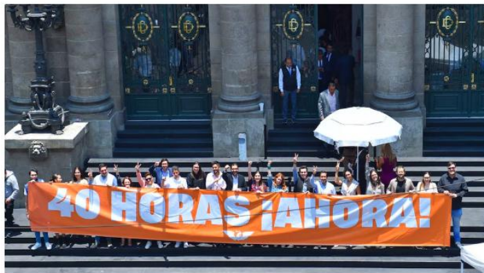
La bancada de Movimiento Ciudadano adelantó su apoyo a la reforma.

En el Congreso esperan que el próximo jueves 20 de noviembre, día en que se conmemora el aniversario de la Revolución Mexicana , la presidenta Claudia Sheinbaum Pardo envíe formalmente la iniciativa de reforma laboral para reducir la jornada semanal de 48 a 40 horas .