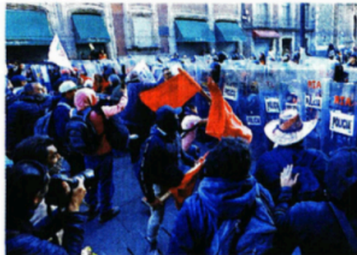
Luego de manifestarse frente a Palacio Nacional, integrantes de la Coordinadora se enfrentaron con fuerzas del orden en el transcurso de su marcha.

ción, los docentes advirtieron que, de no ver avances en sus exigencias, reiniciarían las protestas durante el Mundial de la FIFA el próximo año.