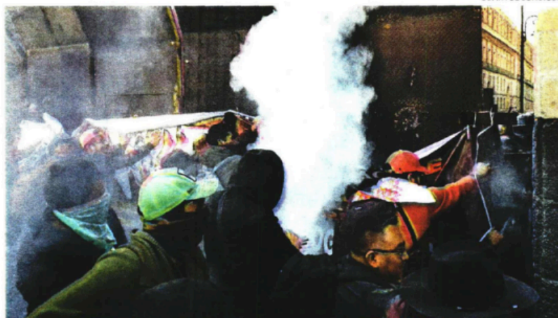
Maestros se enfrentaron con la policía, al intentar derribar las vallas en Palacio Nacional.

Atribuir vínculos partidistas a la Coordinadora solamente "confronta y confunde", señala el magisterio a la Presidenta.