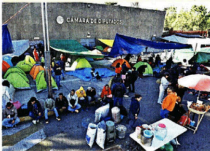
■ Los maestros instalaron un plantón frente a San Lázaro.

"No se entiende cómo, si hay mesas de diálogo -incluso ha habido muchos apoyos- qué necesidad hay de esta manifestación. Además, a dos días de la manifestación de la derecha, vamos a llamarle así", dijo la Mandataria.