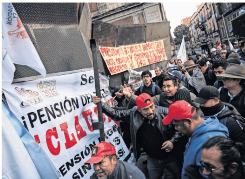
Integrantes de la Coordinadora Nacional de Trabajadores de la Educación se manifestaron afuera de Palacio Nacional y se enfrentaron a elementos policiales al intentar tirar las vallas que resguardan el recinto.