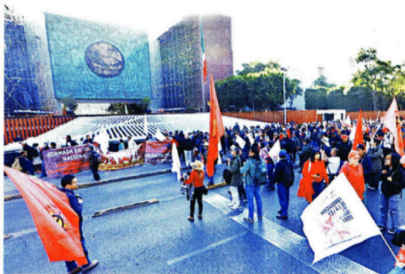
Los docentes instalaron casas de campaña en las inmediaciones del Palacio de San Lázaro, por lo que los diputados suspendieron su agenda legislativa.

"En Zacatecas, la suspensión alcanzó mil 903 centros educativos, cifra que corres-