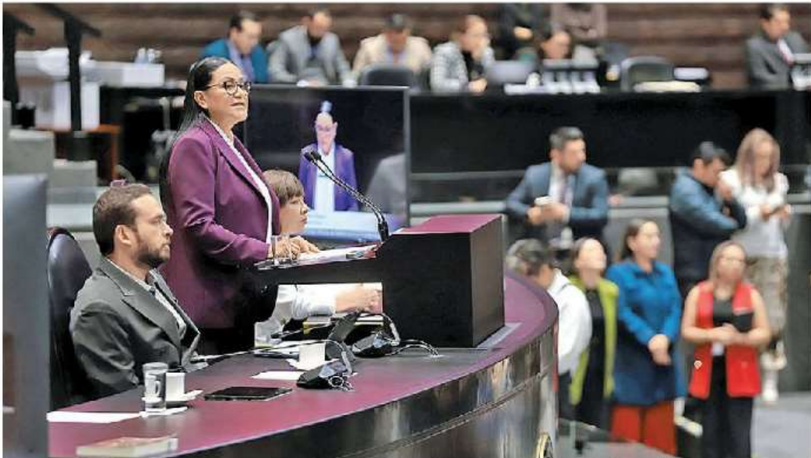
La secretaria habla ante diputados como parte de la glosa del primer Informe de gobierno presidencial. JESÚS QUINTANAR

— La secretaria del Bienestar subrayó que la 4T puso fin a la visión tecnocrática y asistencialista que lucró con los pobres. PAG. 12