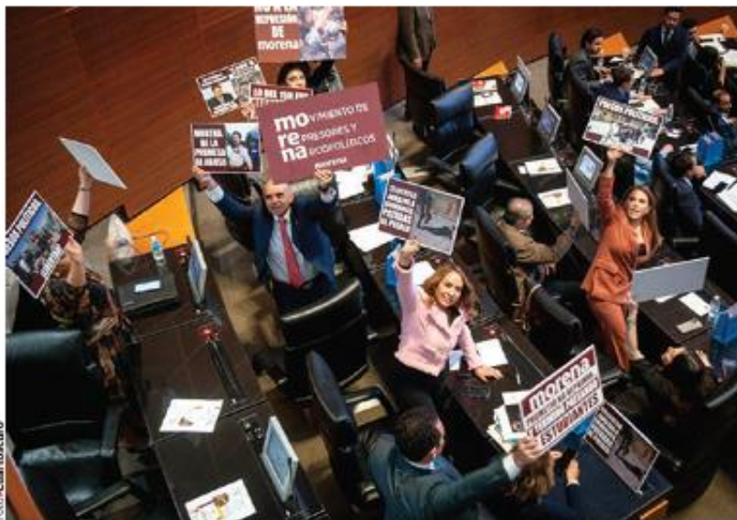
EL SENADO de la República, ayer en sesión ordinaria al legislar contra la extorsión.

› LEGISLADORES AVALAN ampliación de agravantes, como el cobro de piso, uso de menores y la comisión del delito desde penales; sanciona redes de apoyo que faciliten el crimen