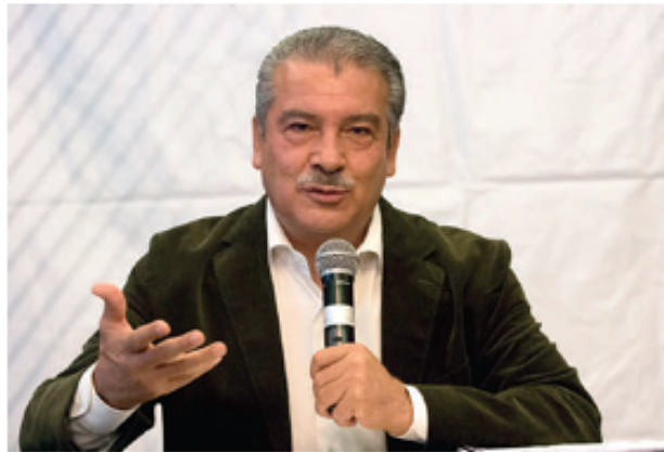
EL SENADOR Raúl Morón en conferencia de prensa, en imagen de archivo.

“Es cierto porque él fue presidente municipal, compitió contra Morena y siempre contrastó contra nosotros y lo siguió haciendo después de ser presidente municipal. Pero eso tiene que ver con cuestiones de carácter político, no con otras circunstancias (...) Él es el que no coincidía con nosotros. Él fue diputado de Morena y después decidió ser candi-