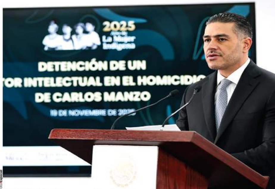
EL TITULAR de la SSPC, ayer, en conferencia de prensa.