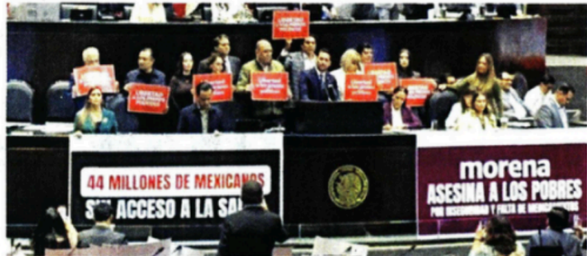
Legisladores de Oposición mostraron pancartas durante la comparecencia de la Secretaria.