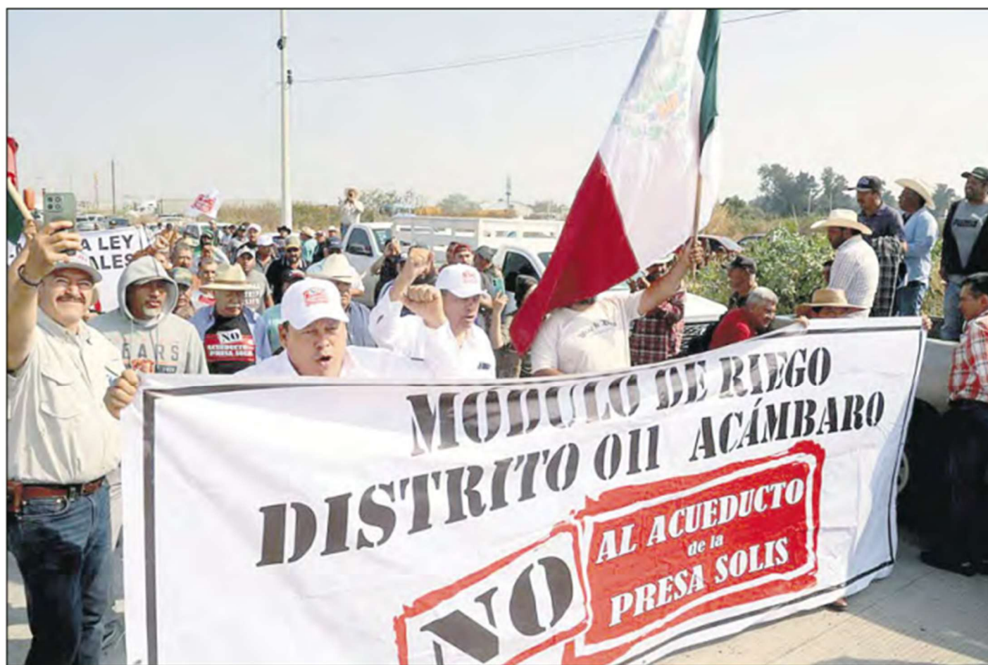
▲ En Guanajuato, campesinos protestaron contra la construcción de un acueducto.

Acusan que no se ha atendido la demanda de 7 mil 200 pesos por tonelada de maíz