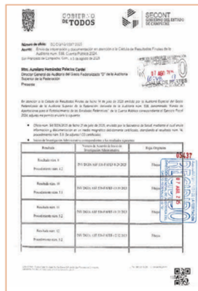
OFICIOS remitidos por la Contraloría estatal que buscaban justificar las anomalías.