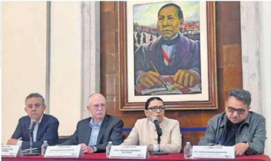
Rosa Icela Rodríguez, titular de la Segob (centro), insistió que no hay motivo para las movilizaciones, porque se mantiene diálogo abierto y permanente.