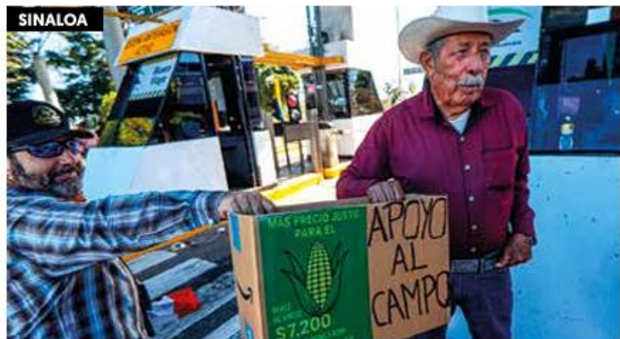
Reclamo. Productores agrícolas, ayer, al exigir apoyo al campo.

Con corte a las 20:30 horas, los bloqueos continuaban en la carretera federal 90 Pénjamo-Santa Ana Pacueco, en Guanajuato, una de las entidades más afectadas con los bloqueos de octubre que también mantuvieron productores agrícolas; y en la carretera Guamúchil - Guasave, a la altura de la caseta Puente Sinaloa.