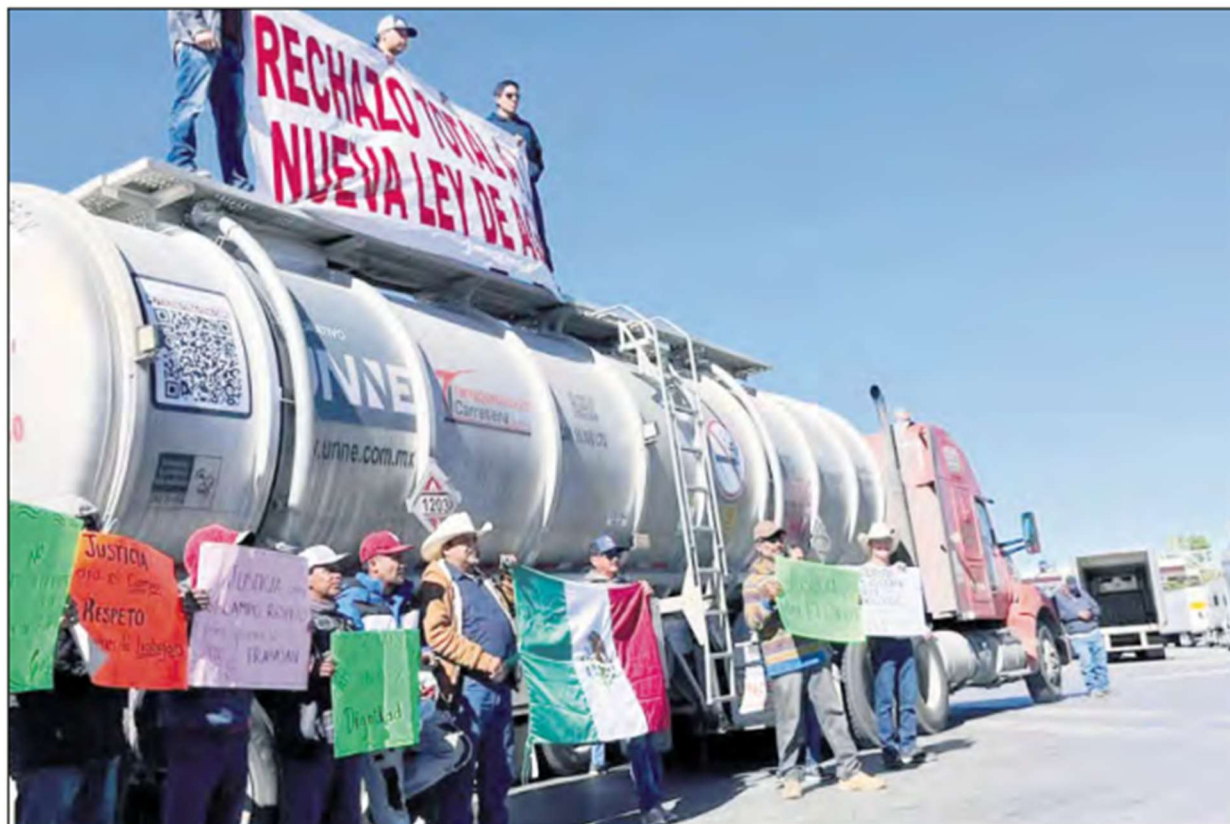
▲ Mil 500 tráileres quedaron varados en la ciudad fronteriza, en Chihuahua.