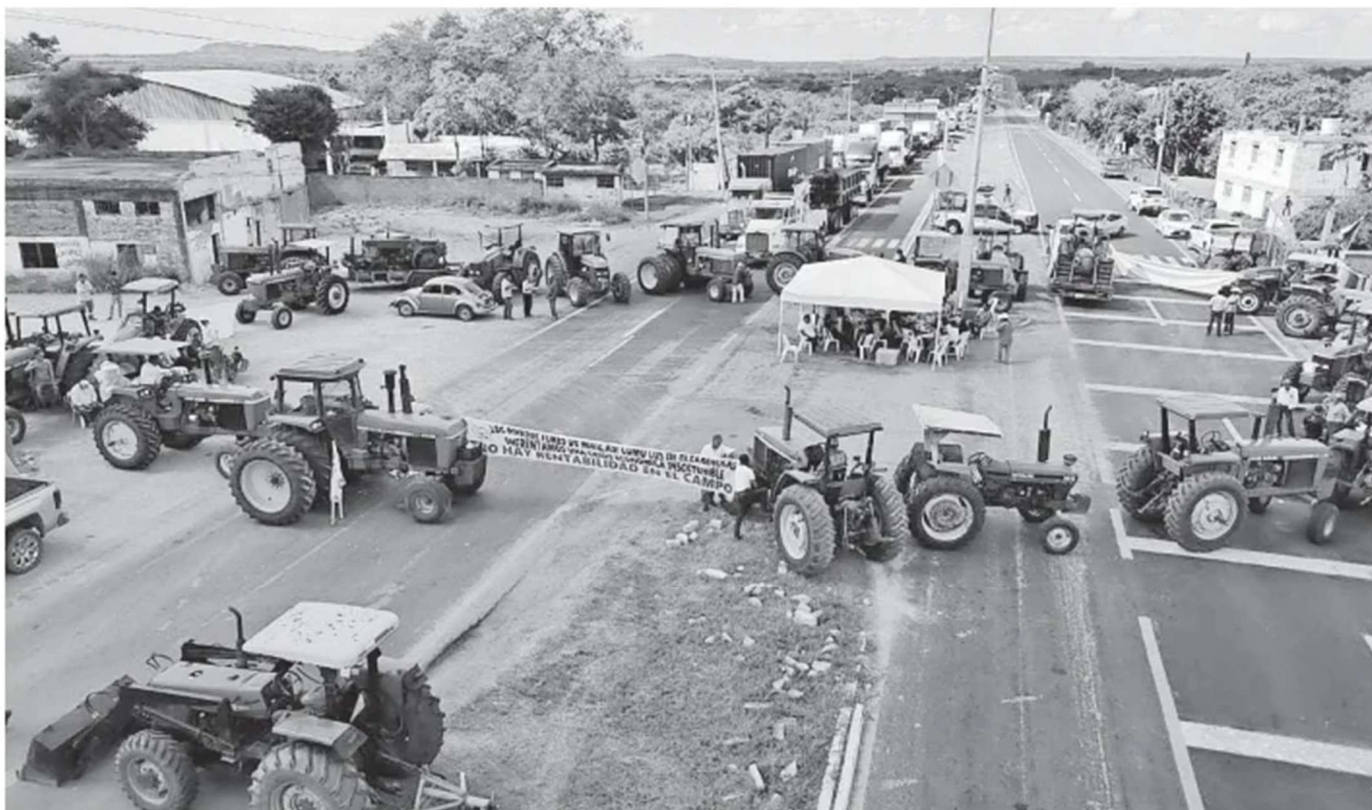
Campeños mantenían ayer el bloqueo en la carretera Tampico-Mante, en Tamaulipas