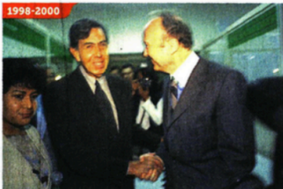
1998-2000 En el Gobierno del perredista Cuauhtémoc Cárdenas, el primero electo en las urnas en el DF, fue titular de Seguridad.

En el sexenio de José López Portillo, el jurista siguió en la estructura del Gobierno federal. Con los años, fue desapareciendo del escena-