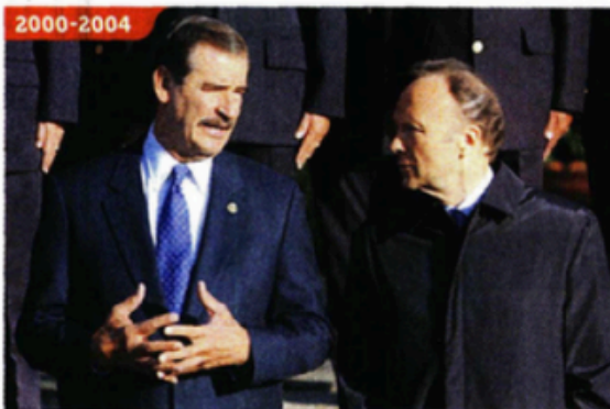
2000-2004 Ocupó la recién creada Secretaría de Seguridad Pública federal en el sexenio del Presidente panista Vicente Fox.