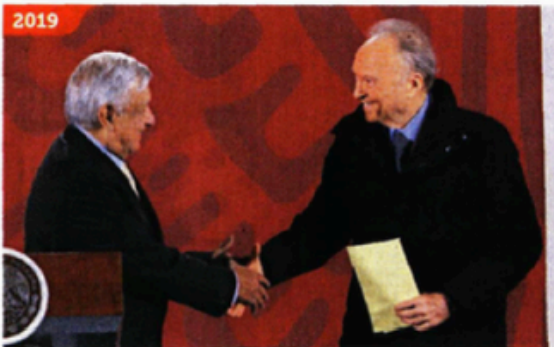
2019 Con el morenista Andrés Manuel López Obrador fue designado Fiscal General.

“ Los ‘enemigos’ del titular de la FGR son el único blanco de la justicia, su justicia. Prueba de ello son las diversas investigaciones (fabricaciones), persecuciones y pesquisas que ha iniciado”.