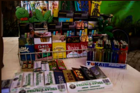
Dos de cada 10 cigarros que se consumen en México provienen del mercado negro.

El auge del consumo de vapeadores y el crecimiento acelerado del mercado negro del tabaco fortalece su presencia en al menos 16 estados del país