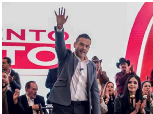
Ulises Mejía Haro, diputado federal dio un mensaje en la Asamblea Informativa de Un Movimiento Honesto.

Ulises Mejía Haro, diputado federal, compartió los avances logrados en los primeros siete años de la transformación nacional: el incremento histórico del salario mínimo, la amplia-