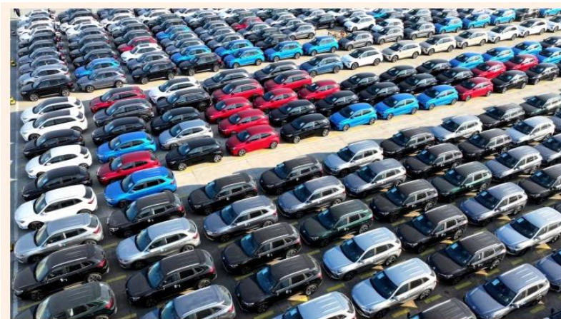
Mexico was the world's biggest buyer of Chinese-made cars in the first half of this year

México aprobó aranceles de hasta el 50 % sobre los automóviles chinos y otros productos, alineándose con las políticas proteccionistas del presidente estadounidense Donald Trump, en un intento por preservar un acuerdo de libre comercio fundamental con su vecino el próximo año.