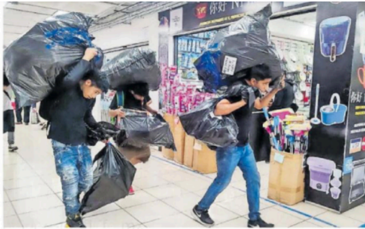
Los ajustes arancelarios forman parte del Plan México.