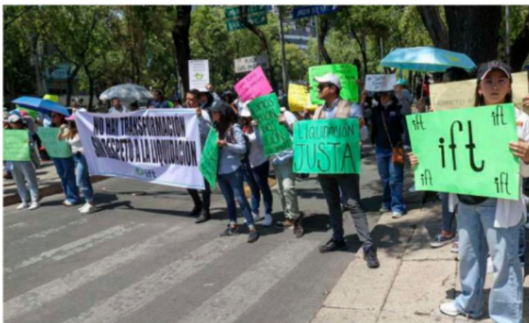
Protesta de ex trabajadores del IFT

fueron advertidos de la inviabilidad de hacer ese doble pago que les puede representar responsabilidades administrativas ante la Secretaría Anticorrupción y Buen Gobierno, esto, de acuerdo con un funcionario vinculado con el proceso ante Hacienda.