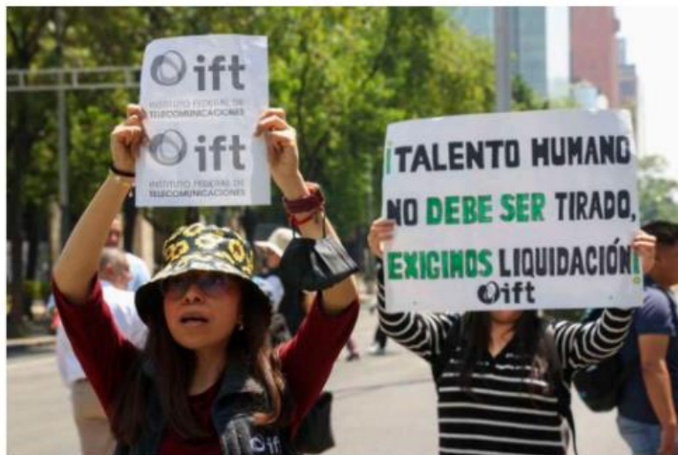
Protesta de ex trabajadores del IFT

En 2016, el personal de libre designación reportó 207; en 2017 eran 217, en 2018, 252 y en 2019 ya sumaban 256. Entre 2021 y 2025 no se cuenta con información pública sobre el número de trabajadores, pero se sabe que ahora son 133 las personas que buscan la doble liquidación.