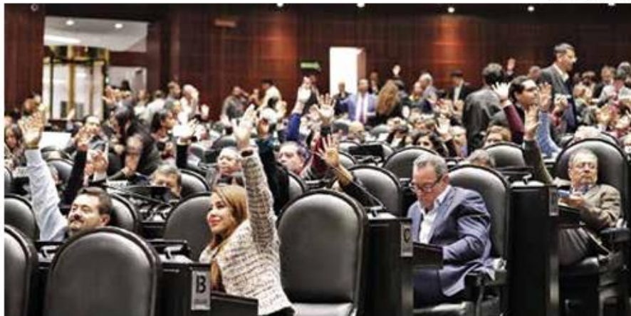
• PLENO. Legisladores de Morena emitieron su voto en favor de la reforma.