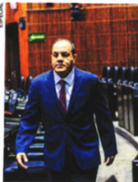
Cuauhtémoc Blanco fue acusado de abuso sexual.

Desde que inició la presente Legislatura, el exgobernador de Morelos hizo acto de presencia votando por las iniciativas de la 4T, la primera registrada fue a favor de la reforma al Poder Judicial el 3 de septiembre de 2024. ●