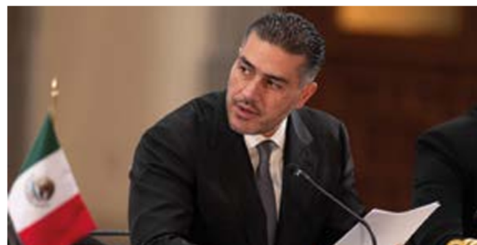
Postura. García Harfuch dijo que este acuerdo "es un paso decisivo".

Se establece la armonización legislativa, la creación de áreas especializadas, el fortalecimiento del 089, entre otros