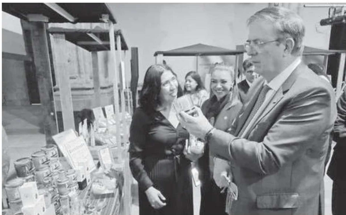
El secretario participó en un evento para pymes en el MIDE