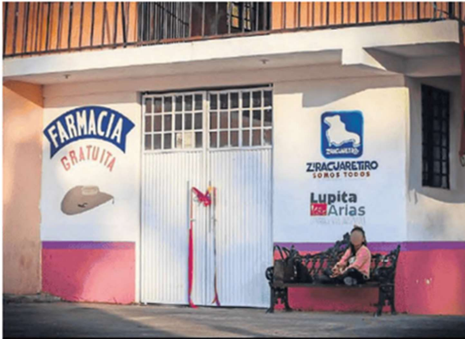
La nueva Farmacia del Sombrero fue inaugurada en San Andrés Coru, Michoacán; es la primera fuera de Uruapan, donde hay seis más.

y se basa en la sinergia entre gobiernos locales y ciudadanía, quienes ponen 70% de las medicinas.