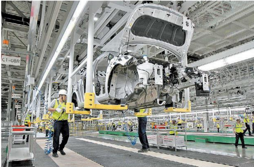
Estados Unidos paga la hora 25 dólares más que aquí en sector automotriz.