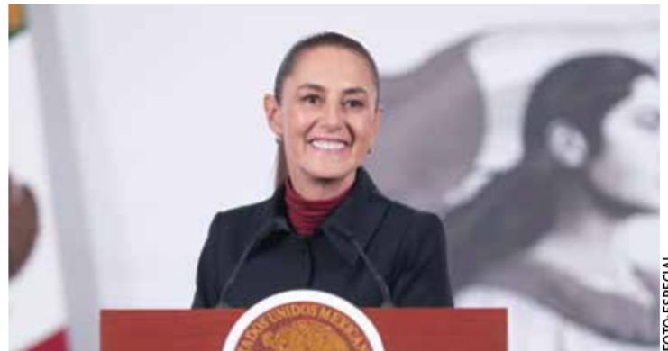
Claudia Sheinbaum , presidenta de México, durante la conferencia matutina del pueblo.

Los 10 temas abordados en los foros que se llevaron a cabo en distintas entidades federativas son: