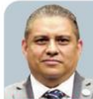
RICHARD URBINA VEGA Fiscalía Especializada de Asuntos Internos