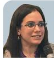
MARIANA DÍAZ FIGUEROA Fiscalía Especializada en Materia de Derechos Humanos