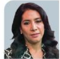
MARIBEL BOJORGES BELTRÁN Fiscalía Especializada en Delitos de Violencia contra las Mujeres