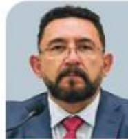
ULISES LARA LÓPEZ Fiscalía Especial en Investigación de Asuntos Relevantes