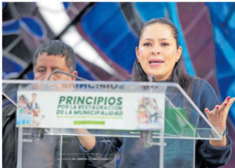
Karen Castrejón, presidenta nacional del PVEM.