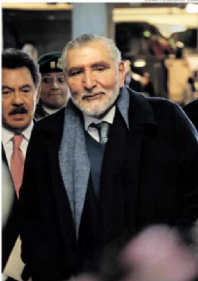
Adán Augusto vuelve al centro de la negociación.

Sheinbaum respaldó la legitimidad de Adán Augusto como coordinador electo por su bancada y subrayó que su función consiste en negociar.