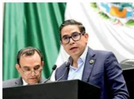
Acusa al gobierno federal de intentar el control político. Especial

El diputado del PAN señaló que su partido defenderá a las instituciones electorales en el Congreso, en las calles y ante instancias internacionales si es necesario. Reiteró que el Instituto Nacional Electoral debe mantenerse como un órgano autónomo para evitar que el gobierno controle los procesos electorales. Finalmente, expuso que Acción Nacional propone incluir en la reforma temas como la segunda vuelta presidencial, voto electrónico, eliminación de la sobrerrepresentación y la conformación de gobiernos de coalición.●