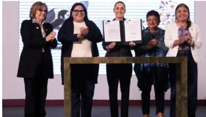
A igual trabajo, igual salario: cerrar la brecha es un derecho.

El decreto incorpora medidas para garantizar la eliminación de la brecha salarial por razones de género