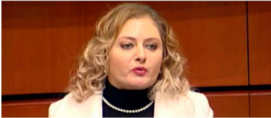
Claudia Anaya Mota, senadora por Zacatecas.

El PRI en el Senado puso en duda los resultados de la investigación preliminar que dio a conocer la Fiscalía General de la República, donde responsabiliza al maquinista por el descarrilamiento del Tren Interoceánico ocurrido en noviembre pasado, que dejó un saldo de 14 muertos y un centenar de heridos.