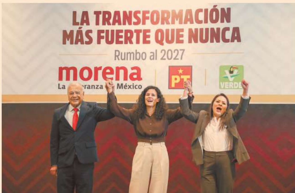
Los dirigentes de los partidos afirmaron estar unidos y apoyar el mandato de la presidenta Claudia Sheinbaum.

Con las manos unidas en todo lo alto, solamente las dos mujeres se desgañitaron gritando vivas; el hombre no las