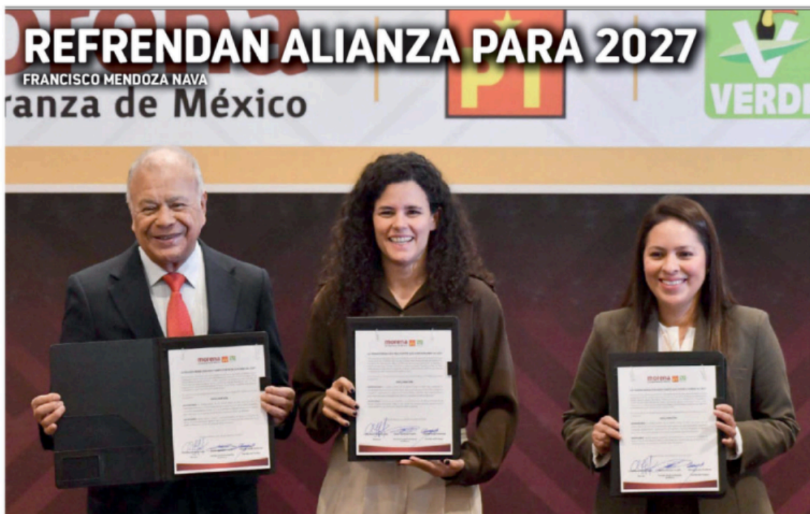
ACUERDAN IR UNIDOS EN LAS PRÓXIMAS ELECCIONES Los líderes nacionales de Morena, Luisa María Alcalde; del PT, Alberto Anaya, y del Verde, Karen Castrejón, pactaron ayer mantener la alianza rumbo a las elecciones del 2027. Buscarán, apuntaron, dar continuidad al proyecto de transformación iniciado en 2018. Los dirigentes ratificaron su "apoyo, respaldo y acompañamiento" a la presidenta Claudia Sheinbaum. Pág. 4