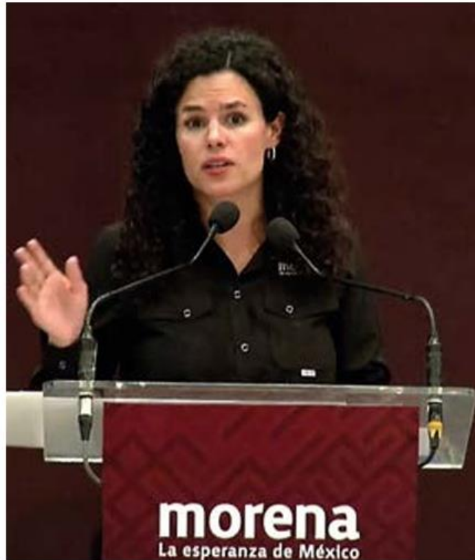
Objetivo. Alcalde Luján expresó que se impulsará la participación ciudadana.