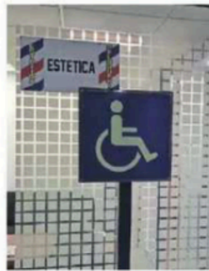
La peluquería se ubica en el basamento del edificio "E".

"Se autoriza e instruye a la Secretaría General y a la Secretaría de Servicios Administrativos y Financieros para que, a través de las Direcciones Generales competentes, se lleve a cabo la continuidad a la prestación de los servicios de peluquería y estética, por el periodo comprendido del 01 de septiembre al 31 de diciembre de