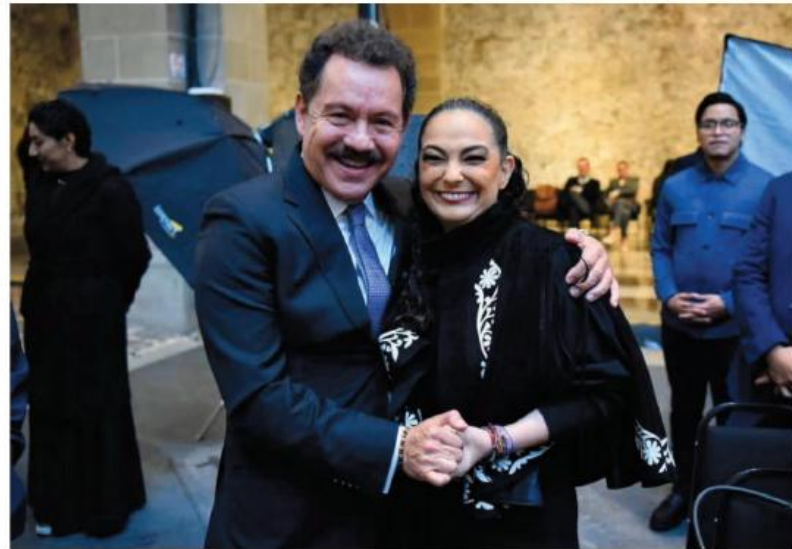
La senadora Olga Sosa Ruiz, junto a Ignacio Mier, coordinador de los senadores morenistas.

Otro para implementar y fortalecer campañas de vacunación sobre la tosferina, uno más para difundir campañas