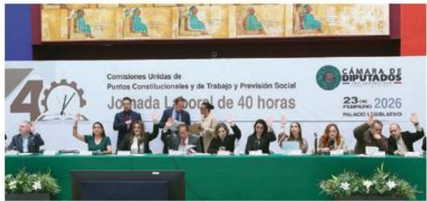
VOTACIÓN en la sesión de comisiones unidas en la Cámara de Diputados, ayer.

» OPOSICIÓN RESPALDA modificación a la Constitución, pero insiste en establecer 2 días de descanso; forma parte de la "primavera de los derechos laborales", dice titular de STPS