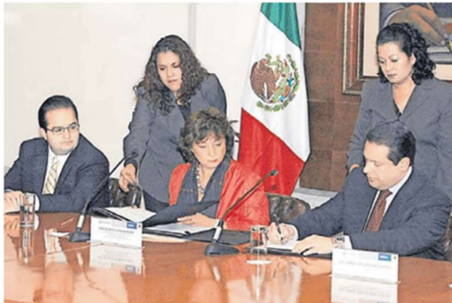
En 2009, Alejandro Poiré, entonces secretario de Gobernación (Izq.), encabezó la estrategia gubernamental denominada "Blindaje electoral".