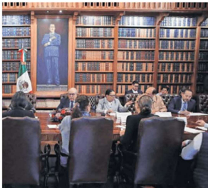
Rosa Icela Rodríguez, titular de Segob, encabeza reunión de la Comisión Presidencial para la Reforma Electoral.