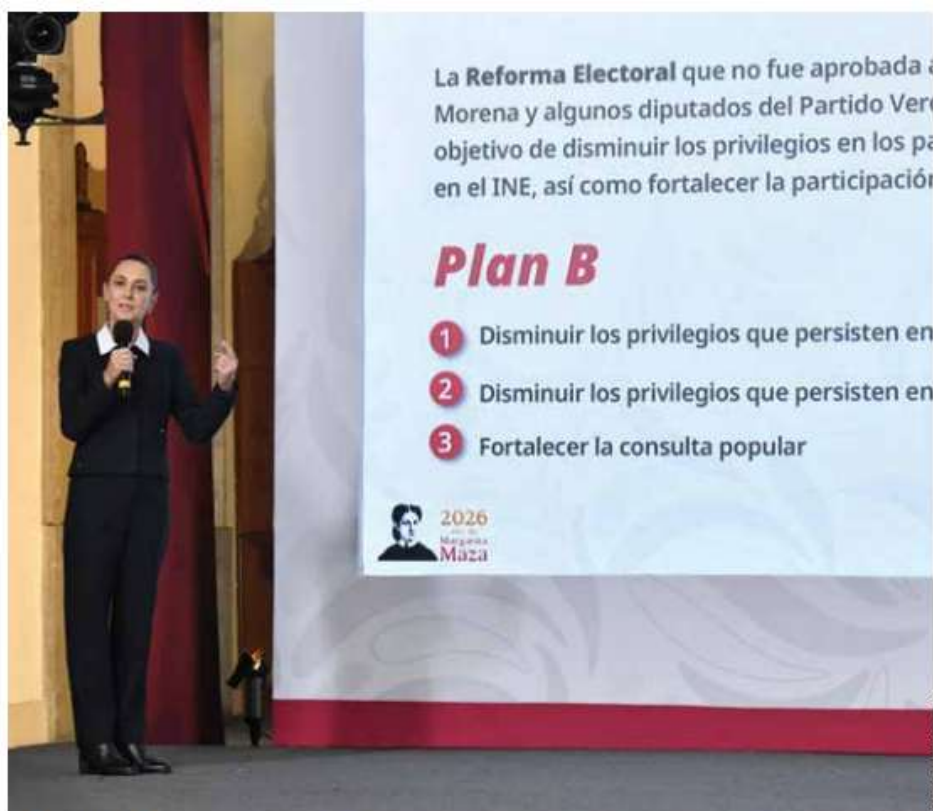
La presidenta Claudia Sheinbaum detalló que con la nueva propuesta se pretende establecer un tope presupuestal en materia electoral.