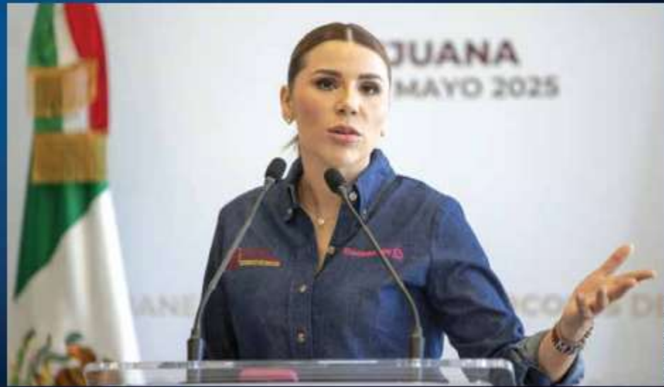
Marina del Pilar Ávila Olmeda, gobernadora de Baja California, deberá aclarar el destino de los recursos entregados para programas sociales.

Recursos de Participaciones Federales que habrían sido transferidos al Congreso de Baja California para apoyos sociales no fueron comprobados por la administración de la gobernadora Marina del Pilar Ávila Olmeda