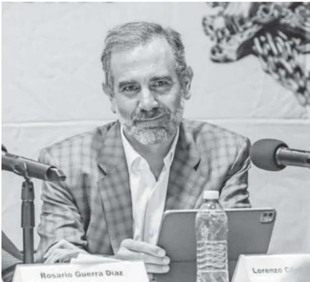
El expresidente del INE, Lorenzo Córdova