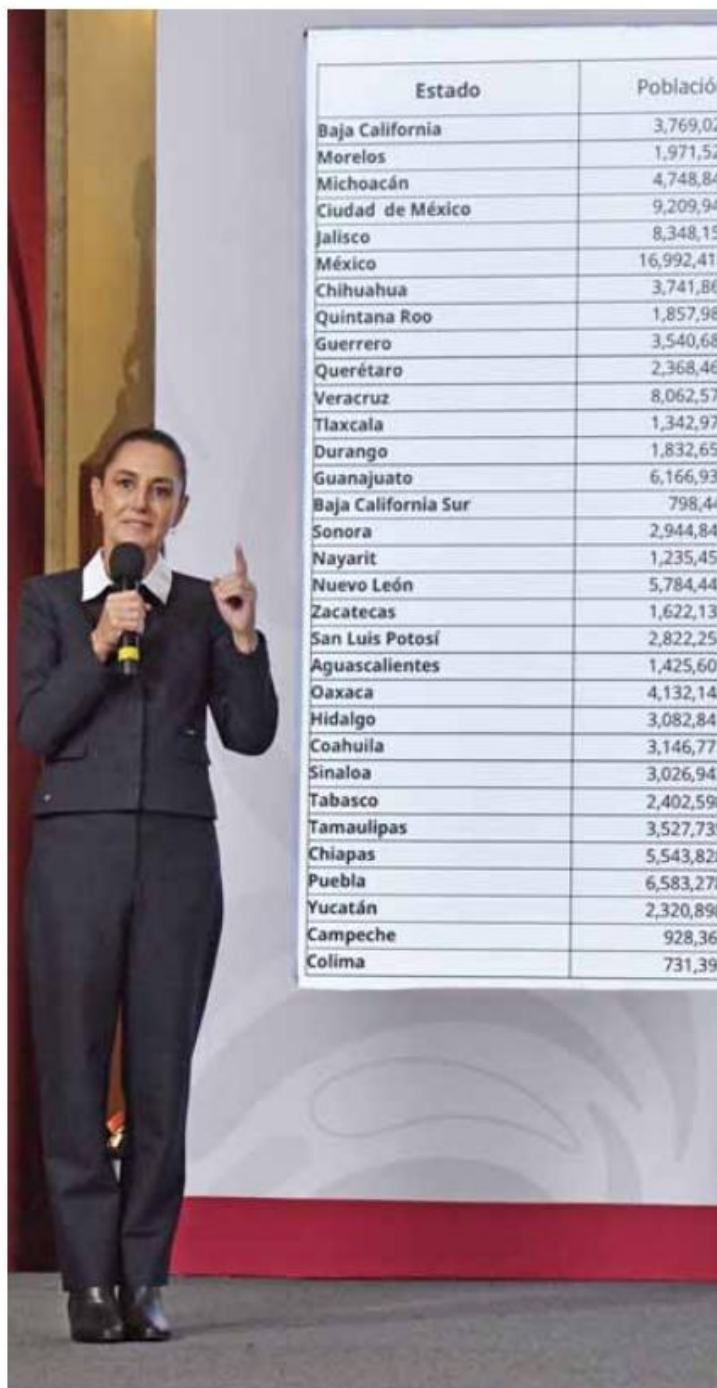
Mañanera. La presidenta fue enfática al precisar que acabará con los privilegios.

Asimismo, Sheinbaum resaltó que con esta estrategia se obtendrá un ahorro de 4 mil millones de pesos, recursos que no serán para la federación, sino para los gobiernos locales y serán usa-