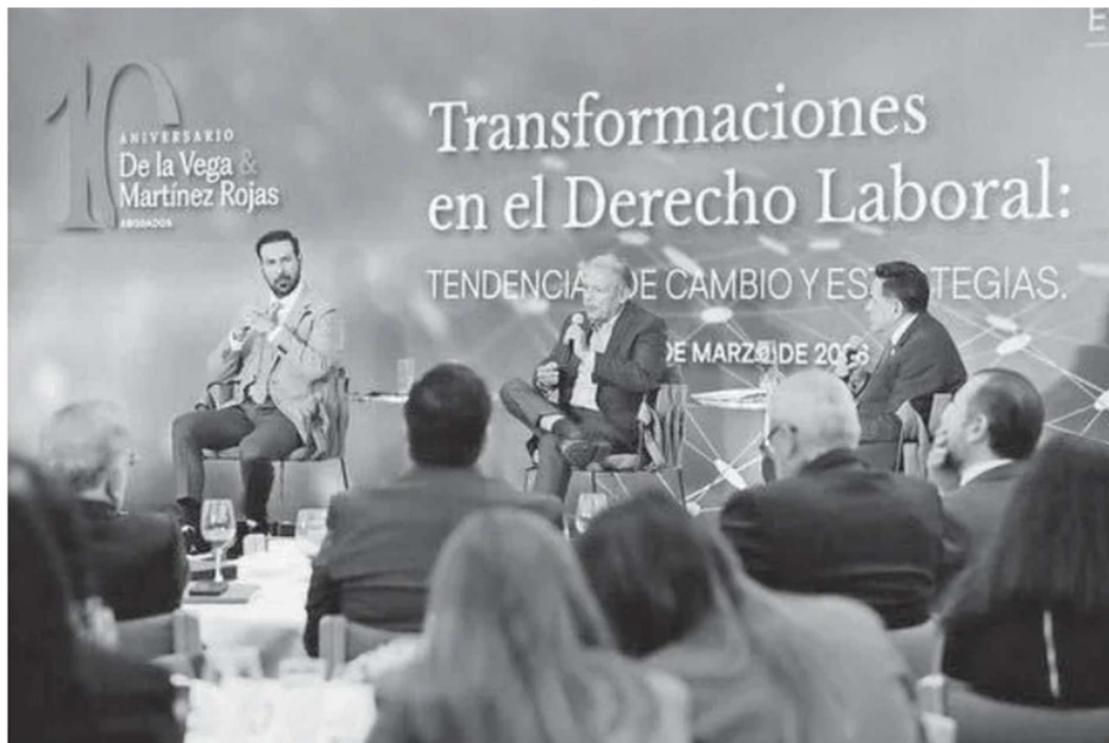
Titulares de la CTM y de la CTC participaron en el foro Transformaciones en el Derecho Laboral

LÍDERES gremiales hicieron hincapié en la calidad de la mano de obra y de la capacitación para enfrentar los desafíos