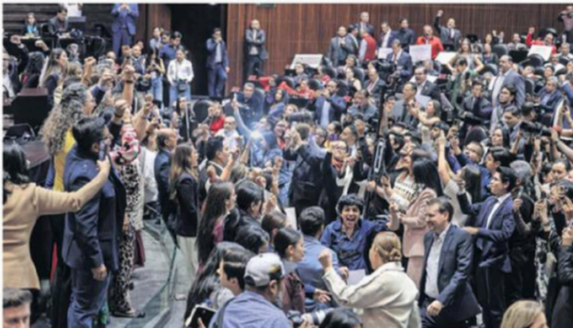
El miércoles fue rechazada en el pleno de San Lázaro la reforma electoral de la presidenta Claudia Sheinbaum.

Expertos consideran que el plan B es una respuesta desesperada de la Presidenta, en un momento de ruptura de su movimiento.