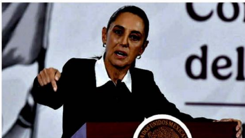
“No olviden por qué fueron electos”, señaló la mandataria.

En la reunión les dije lo que les estoy diciendo en este momento a ustedes. Dije: ‘No se nos olvide por