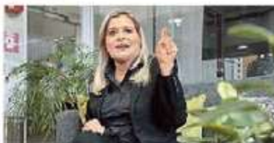
María Eugenia Campos

El plan B, “aberrante”; mete mano a soberanías estatales