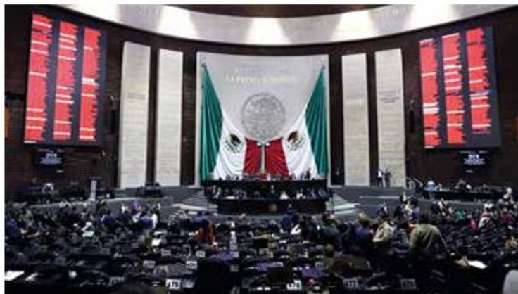
De madrugada. El dictamen se aprobó en lo particular con 315 votos a favor.

En una votación en lo particular con 315 votos a favor, 89 en contra y cero abstenciones, la minuta se turnó al Senado. El debate subió de tono en la madrugada debido a un artículo transitorio que fue eliminado en el pleno.