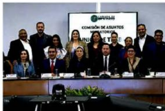
Integrantes de la Comisión de Asuntos Migratorios de la Cámara Baja. Especial

Otros legisladores coincidieron en que la nueva legislación debe ser de aplicación general para autoridades federales, estatales y municipales.●