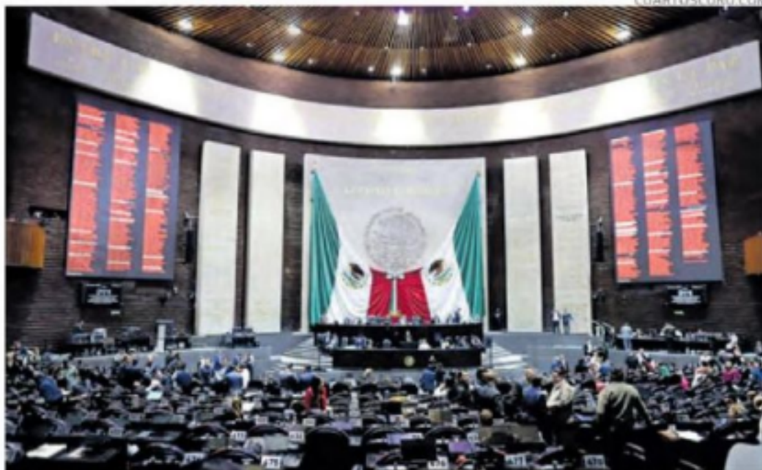
Las iniciativas presidenciales fueron aprobadas en la Cámara de Diputados.