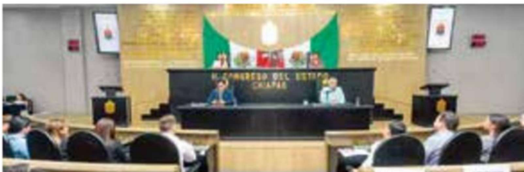
CONGRESO DE CHIAPAS

Al respecto, la presidenta Claudia Sheinbaum ha aclarado que esta reforma excluye a los empleados con contratos colectivos vigentes: “Nos estamos refiriendo... a los altos mandos que a la fecha con recursos públicos o sea recursos del pueblo les tenemos que seguir pagando altísimas pensiones”.