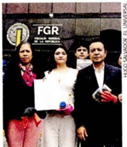
Diputados de Acción Nacional afuera de la FGR.