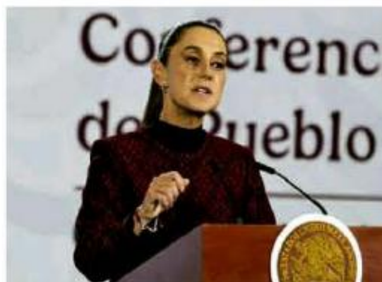
Dijo que Morena decidirá si mantendrá alianza con PT y PVEM.

“Solo la votaron tres partidos. Los otros no quisieron votarlo, eso es muy importante; los otros partidos no quisieron votarlo, con uno u otro argumento, pero no quisieron votar eso; ellos prefieren que el recurso se vaya para beneficios personales de unos cuantos servidores públicos, o de algunos jubilados, a que se vaya para la gente. •