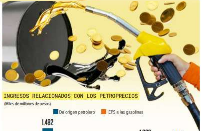
INGRESOS RELACIONADOS CON LOS PETROPRECIOS

Otro aspecto en el cual los especialistas se enfocaron es en el tema del déficit y de