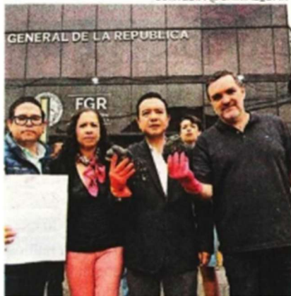
Diputados del PAN, ayer, en FGR.