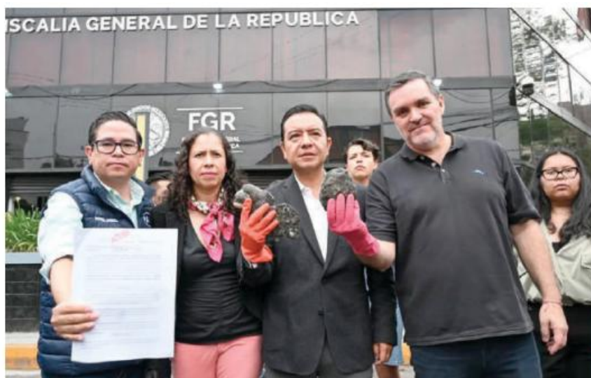
LEGISLADORES PANISTAS, ayer en la FGR para denunciar contaminación en el golfo.

Entre el 6 y el 10 de febrero, comenzaron los primeros reportes de manchas pequeñas en una zona cercana a la plataforma Abkatún, frente a las costas de Campeche. Posteriormente, el 14 de febrero, la mancha alcanzó 50 km 2 y el vertido de petróleo continuó por tres días, dispersándose hasta llegar a las costas de Veracruz y Tabasco.