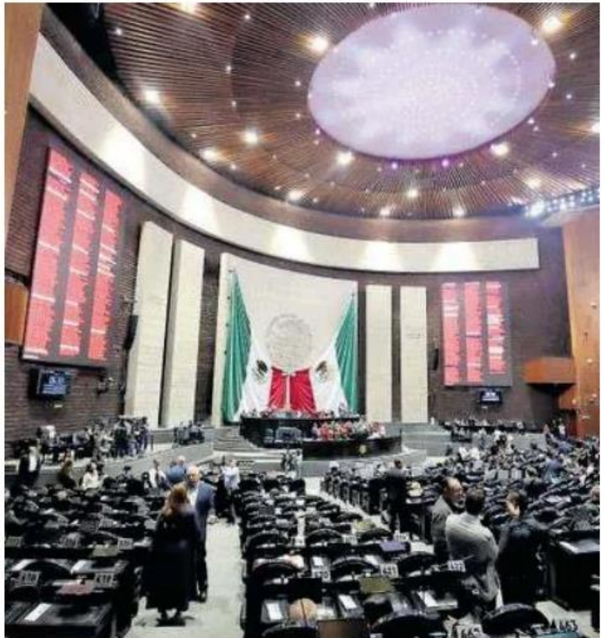
Sesión en Cámara de Diputados

Los legisladores de Morena, Partido del Trabajo (PT), Verde Ecologista de