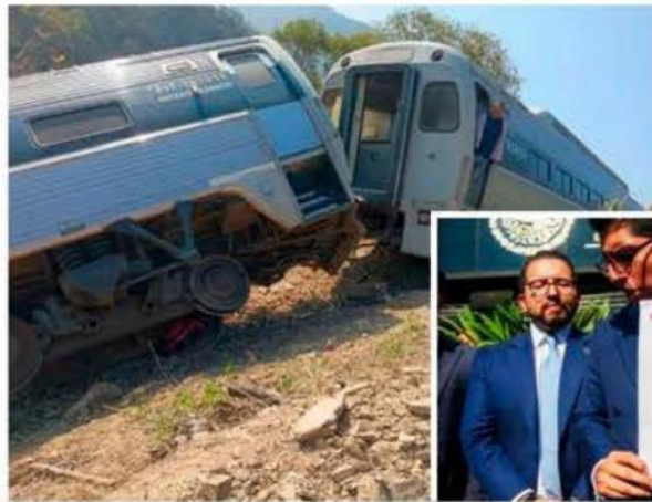
En enero abogados de las víctimas presentaron una demanda en la FGR por 3 delitos en el descarrilamiento

En cuanto al delito de ataques a las vías generales de comunicación, fue descartada con los dictámenes periciales en materia de arquitectura e ingeniería civil, así como con el de seguridad industrial, después de una minuciosa inspección y toma de muestras, con el que se