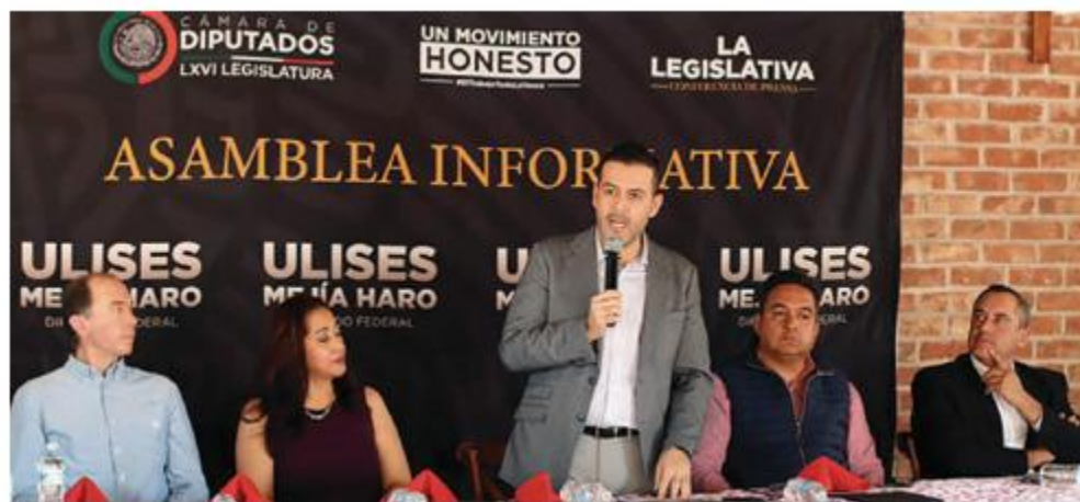
EL LEGISLADOR federal, en asamblea informativa en foto de archivo.

Por ciento del grano del país se produce en Zacatecas