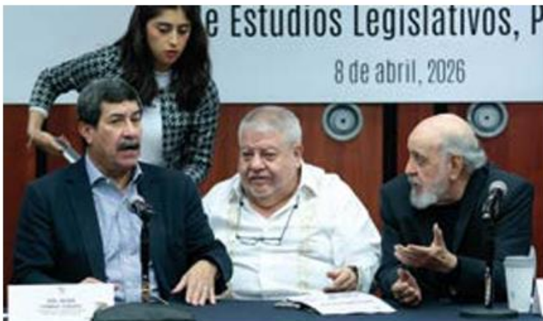
Propuesta. Javier Corral (izq.) y Ramírez Cuéllar plantean posponer un año la elección judicial.

Ramírez Cuéllar apoya un examen y un proceso de certificación de candidatos que requeriría que los aspirantes a jueces hayan pasado “al menos un determinado periodo en el poder judicial”, y pidió una reducción en el número de candidatos.