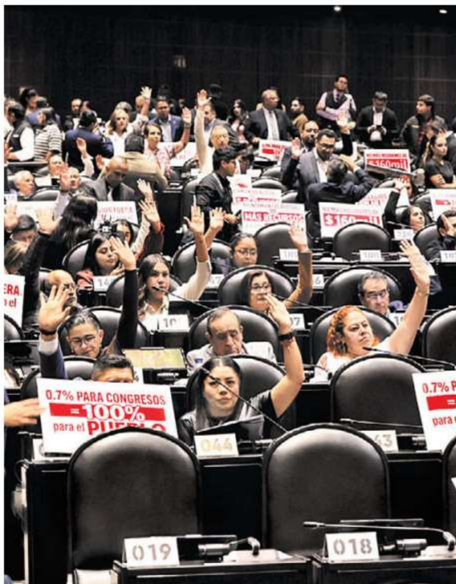
Protesta en el pleno de San Lázaro.