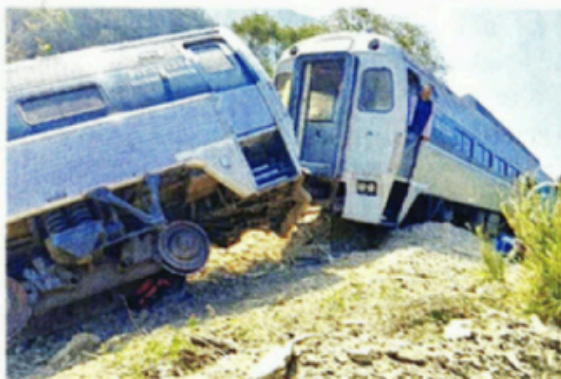
La Fiscal Ernestina Godoy ratificó que el descarrilamiento del Tren Interoceánico se debió al exceso de velocidad

"No obstante, lo anterior no implica una exoneración absoluta de responsabilidades en otros ámbitos jurídicos, ni limita las facultades legales de la Auditoría Superior de la Federación y de la Secretaría Anticorrupción y Buen Gobierno para, en el ámbito de sus atribuciones, formular las denuncias que estimen pertinentes por hechos posiblemente constitutivos de delito, derivados de los hallazgos administrativos o financieros detectados no asociados al siniestro".